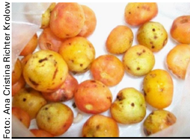
Figura 4. Butiá maduro