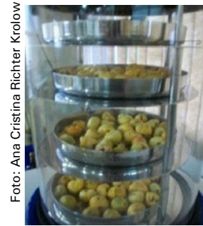
Figura 6. Butiás no liofilizador.