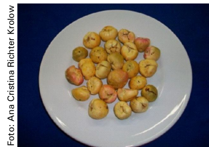
Figura 7. Butiá inteiro liofilizado

Os frutos congelados são dispostos nas bandejas do liofilizador, sem formar camadas muito espessas. Ligar o equipamento e manter os butiás no liofilizador por cinco dias para completa retirada de água.