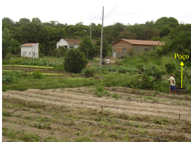
Figura 2. Barragem subterrânea, Sítio Almeida, Lagoa Seca, PB (Foto: Manoel Batista de Oliveira Neto).

Em algumas regiões tem se constatado problemas de salinidade nas áreas de plantio das barragens subterrâneas devido, principalmente, a problemas relacionados à qualidade da água dos riachos que abastecem a barragem subterrânea e a problemas de liberações de sais pela rocha. Fazendo-se necessário,