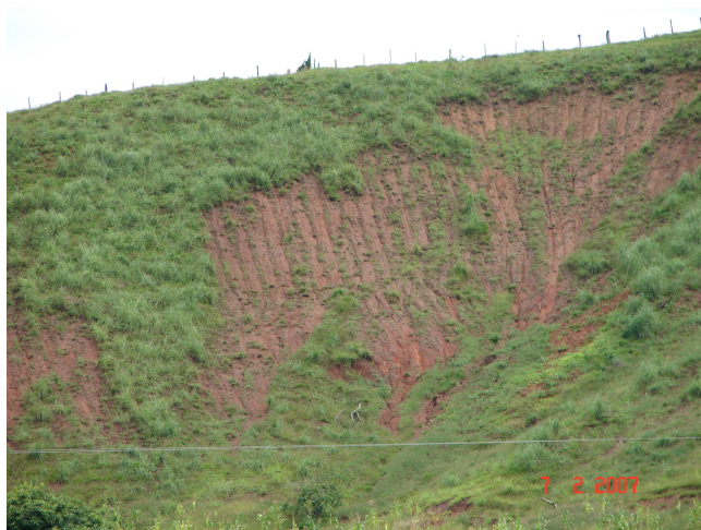
Figura 2. Manejo inadequado do solo em relevo montanhoso do RJ. Município de São José de Ubá - RJ (2007).

Desta forma, é preciso que as nascentes sejam mapeadas e monitoradas como ocorreu no Estado de Minas Gerais no Projeto olho d'água - preservação e recuperação de nascentes (DUARTE et al., 2004), no sentido de identificar processos de degradação de sua qualidade ou redução de vazão. Estes processos vem sendo bem comum em municípios do interior do Rio de Janeiro, principalmente na área rural, onde a população recorre aos poços rasos (cacimbas) para abastecimento doméstico, devido ao fato das nascentes terem secado. Por outro lado, estas cacimbas são construídas muitas vezes próximo às fossas sépticas, havendo contaminação por nitratos e coliformes fecais (MENEZES et al., 2009).