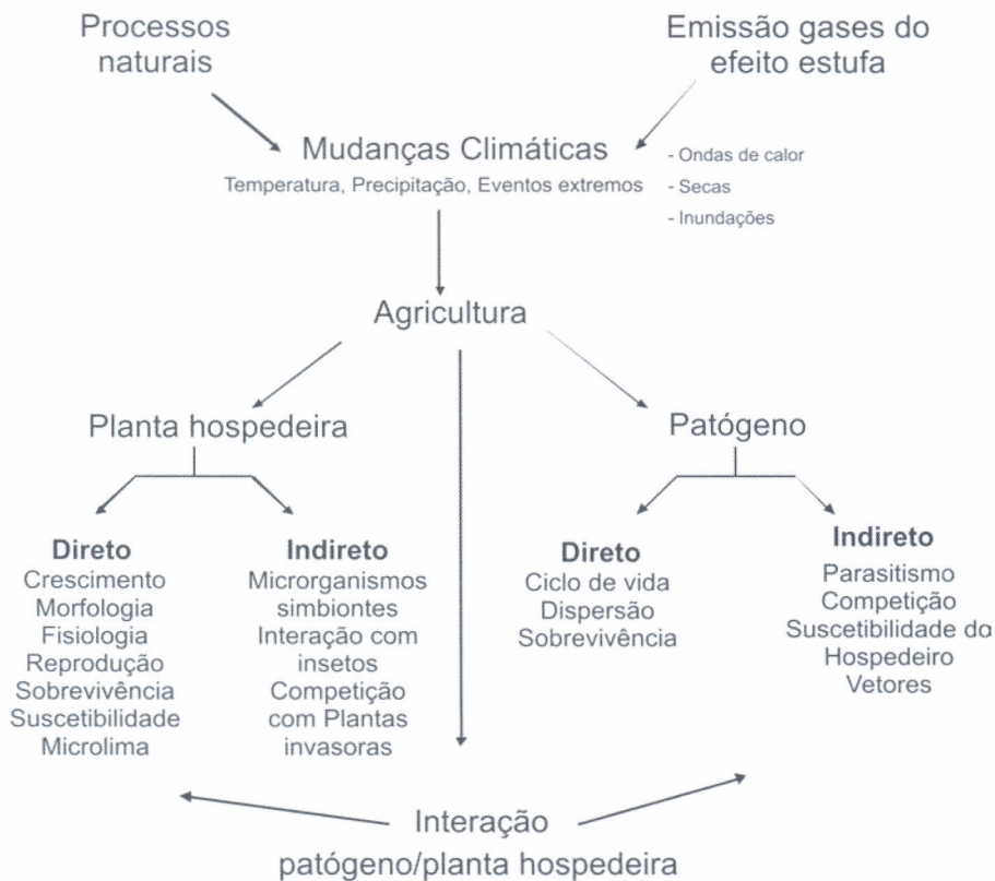
Figura 1 – Esquema dos impactos das mudanças climáticas sobre problemas fitossanitários

As mudanças no clima podem produzir impactos sobre problemas fitossanitários por diferentes vias; por um lado, causando impactos diretos sobre a planta hospedeira, interferindo no seu crescimento, fisiologia, morfologia, reprodução, sobrevivência e também no microclima e, por outro lado, causando impactos indiretos sobre a mesma, como as alterações na interação com microrganismos simbiotes, interação com insetos e competição com plantas invasoras. Além disso, as mudanças climáticas podem afetar, direta e indiretamente, o patógeno causador da doença. O efeito direto pode ocorrer por meio de interferências no seu ciclo de vida, além de afetar a dispersão e a sobrevivência dos microrganismos, e indiretamente, afetando as interações de parasitismo, competição e, ainda, a suscetibilidade do hospedeiro (Figura 1).