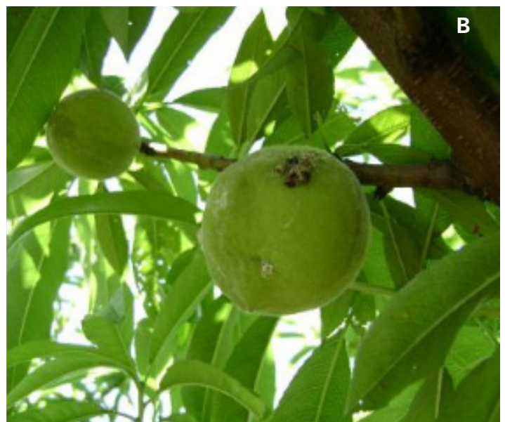
Fig. 4. Danos causados por Grapholita molesta . A) Ponteiros e B) Frutos.