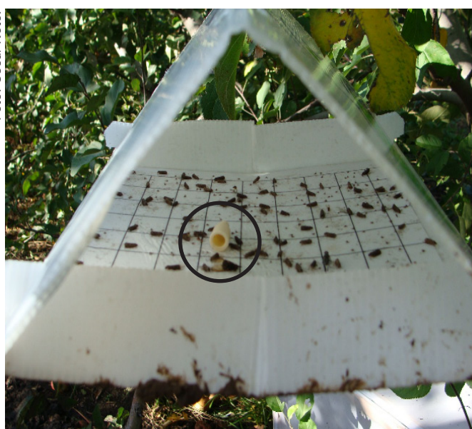
Fig. 6. Armadilha Delta, com liberador de borracha (círculo) empregada para o monitoramento de Grapholita molesta .

A armadilha Delta é fixada em plantas no interior do pomar, numa altura de aproximadamente 1,7 m, em local livre de ramos que possam interferir na formação e distribuição da pluma de odor, potencializando, assim, a captura dos machos.