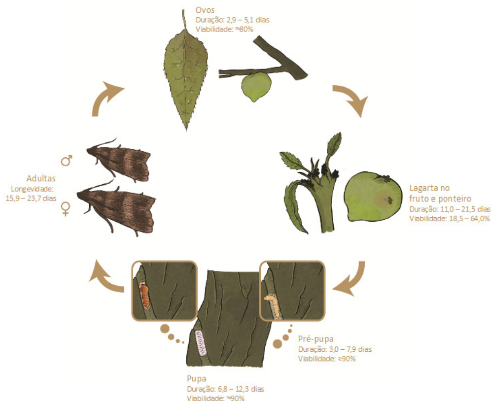
Fig. 2. Ciclo biológico da Grapholita molesta em pessegueiro.