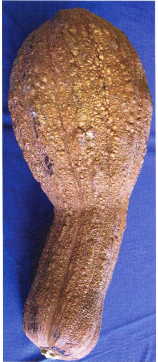
Fruto Cucurbita sp.

Da mesma forma, deve-se ampliar as atividades de coleta voltadas à conservação ex situ . Como estratégia para favorecer a conservação e o uso sustentável dessa variabilidade genética, deve-se promover pesquisa participativa junto aos produtores, com a finalidade de orientá-los e capacitá-los na conservação das sementes, passando pela otimização do sistema de produção, até a orientação para o mercado produtor. Estas medidas contribuirão para ampliar o uso sustentável desses recursos genéticos, além de promover a conservação e gerar renda para os produtores locais.