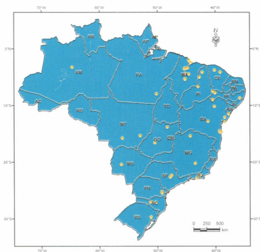
Locais de registro de coletas de material para herbário.