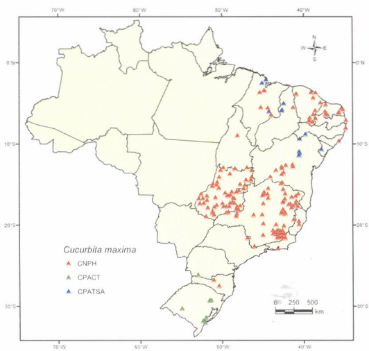
Locais de coleta de Cucurbita maxima .