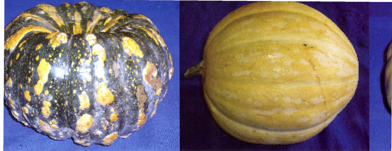
Variabilidade genética de frutos de abóbora ( Cucurbita spp ) nos estados do Tocantins e Mato Grosso.

CNPCT, Embrapa Hortaliças - CNPH, Embrapa Semi-Árido - CPATSA, Instituto Agrônomo de Campinas – IAC e a Universidade Federal de Viçosa - UFV. As respostas indicaram, entre outras, a falta de padronização dos descritores utilizados para coleta de germoplasma.