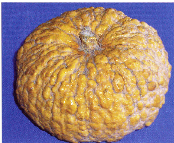
Fruto de Cucurbita sp.

É importante registrar a ampla variabilidade genética existente no gênero Cucurbita , com a predominância do cultivo tradicional. A produção é voltada para consumo da própria família, com excedente comercializado nas feiras e mercados locais. Predomina também o uso de adubos orgânicos, além do cultivo em sistemas agroecológicos, sendo também raro (20%) o uso de produtos químicos no controle de