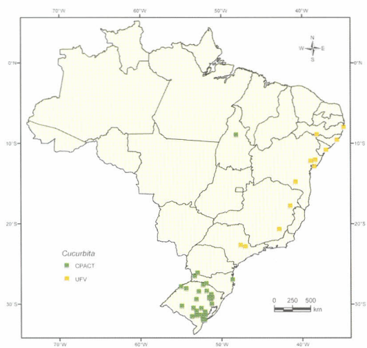
Locais de coleta de Cucurbita spp.