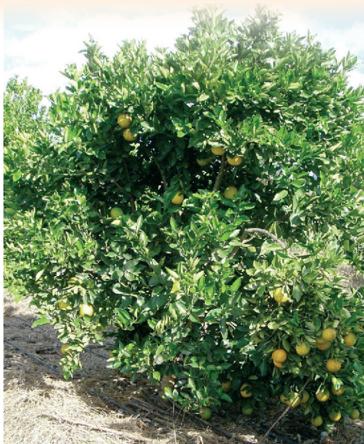
Laranjeira 'Bahia CNPMF 101'

A produção de citros no Brasil, nos seus primórdios, teve a laranjeira 'Bahia' como a sua principal variedade. Originada no bairro do Cabula, em Salvador, foi introduzida nos EUA no final do século XIX (foto) e tornou-se responsável pelo desenvolvimento da citricultura nos cinco continentes. No Brasil, em função do direcionamento da produção para o mercado de suco concentrado congelado, essa e outras variedades de mesa foram substituídas por aquelas de uso industrial. Com a recomendação do clone 101 da laranjeira 'Bahia' a Embrapa na sua missão de privilegiar a citricultura de mesa, presta-lhe esta homenagem. A laranjeira 'Bahia CNPMF 101' não apresenta caneluras de tristeza, nem descamamento eruptivo e está livre do viríde da exocorte e da bactéria Xylella fastidiosa , causadora da CVC.