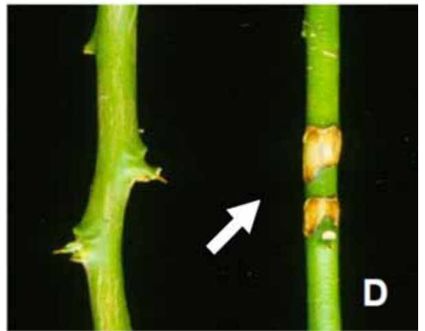
Figura 1. Sintomas da exocorte de lima ácida 'Tahiti': A, B e C. Rachaduras longitudinais observadas no tronco e ramos; D. Lesões em ramos verdes.