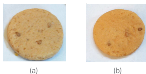
Figura 3. Biscoitos com TSDG (a) e com sementes de GI (b).

A Figura 3 apresenta a aparência dos biscoitos elaborados. O biscoito com TSDG apresentou-se mais claro, enquanto que o com GI apresentou-se escuro e compacto.