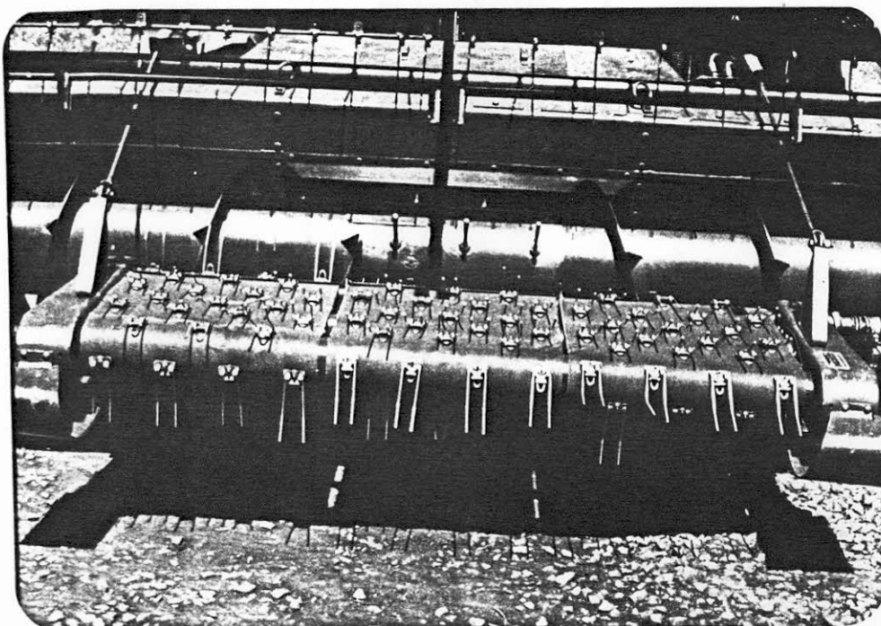
Figura 2. Recoletor de culturas.