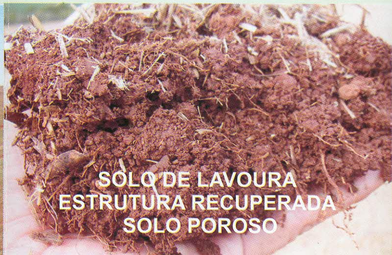
SOLO DE LAVOURA ESTRUTURA RECUPERADA SOLO POROSO