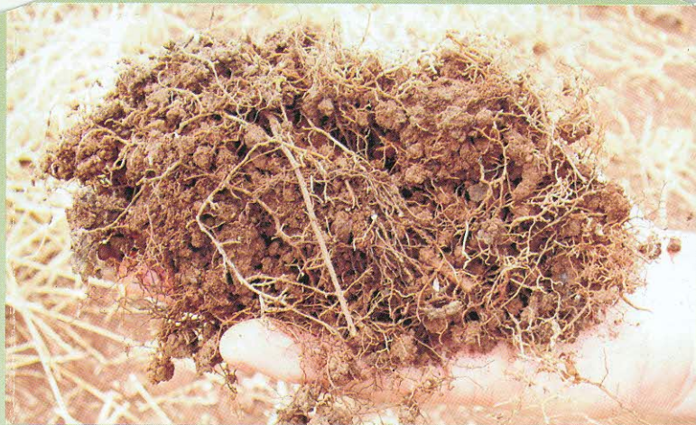
SOLO DE MATA ESTRUTURA PRESERVADA SOLO POROSO