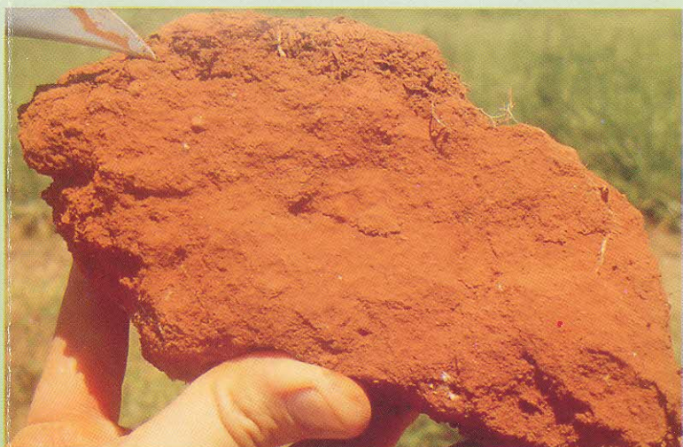
SOLO DE LAVOURA ESTRUTURA DEGRADADA SOLO COM DEFICIÊNCIA DE POROS - SOLO COMPACTADO -