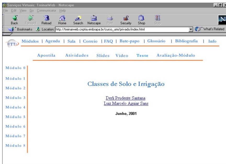
Fig. 2. Ferramentas do ambiente.