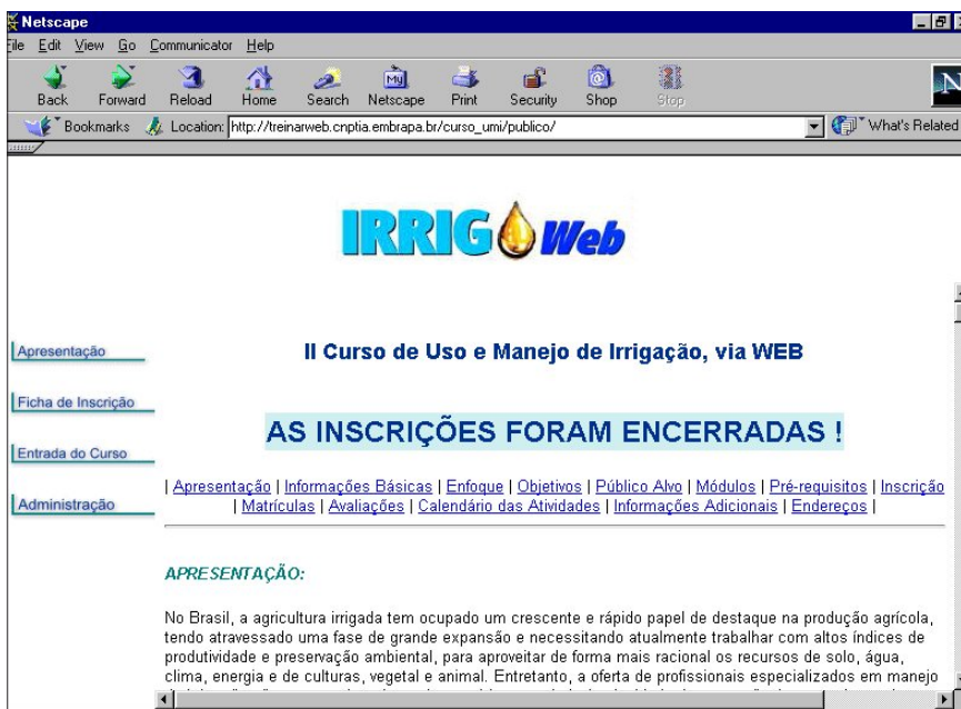
Fig. 1. Página de apresentação do IrrigaWeb.