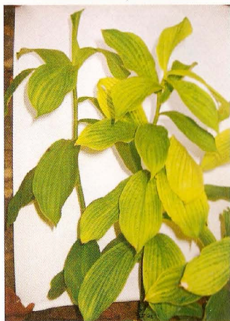
Fig. 1. Cana-do-brejo ( Costus spicatus )

As plantas medicinais possuem um grande potencial na cura de doenças, sendo, muitas vezes, preferidas pela população pelo fato de serem naturais.