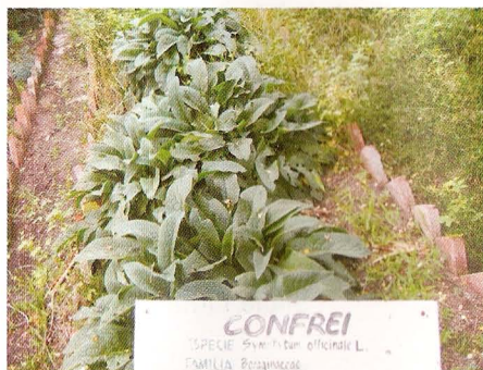
Fig.2. Confrei ( Syphytum officinale )

As plantas produzem substâncias complexas com diversas finalidades, inclusive de auto-defesa. No organismo humano, algumas destas substâncias atuam como medicamentos, sendo conhecidas como princípios ativos.