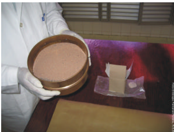
Fig. 4. Tamisação de uma amostra de solo.

Após a moagem, a amostra é passada em peneira com malha de 2 mm (Fig. 4). O material retido no peneiramento é descartado ou guardado de acordo com a recomendação do solicitante 1 .