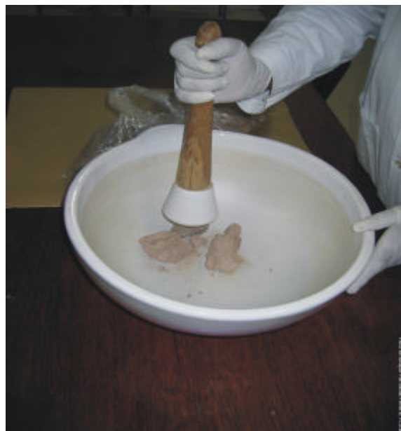
Fig. 3. Moagem de uma amostra de solo.

A amostra seca pode apresentar ainda alguns torrões menores, aos quais há necessidade de utilizar almofariz com pistilo de porcelana para uma perfeita moagem (Fig. 3). Deve-se ter o cuidado de não moer cascalhos e calhaus.