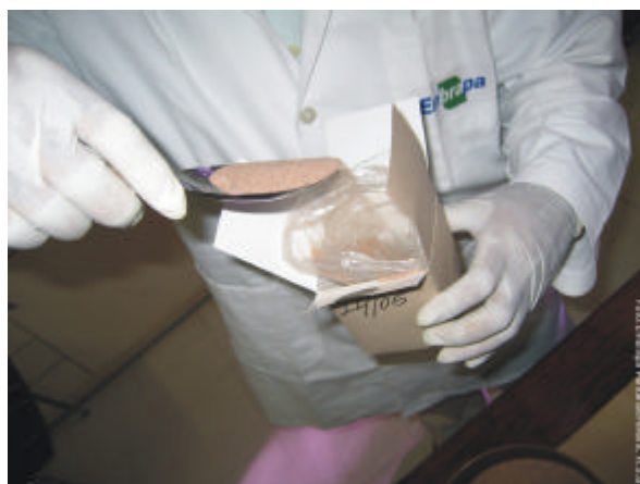
Fig. 5. Acondicionamento de uma amostra de solo.

Embora seja pequena a quantidade de amostra necessária para todas as determinações (< 50 cm 3 ), deve-se preparar quantidade maior (> 300 cm 3 ), para facilitar a pesagem, além de possíveis repetições, caso haja necessidade.