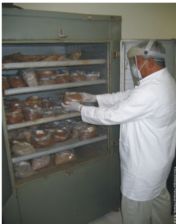
Fig. 2. Estufas para a secagem das amostras de solo.

Os torrões maiores são quebrados manualmente e, em seguida faz-se o revolvimento da amostra para agilizar a secagem. As amostras são secas a 40°C em estufas com circulação de ar (Fig. 2). A temperatura de secagem não pode exceder a 40°C, pois temperaturas mais elevadas podem acarretar alterações nos teores de fósforo, potássio, enxofre, ferro e manganês, dentre outros. O tempo de secagem varia de acordo com a amostra. Para amostras com alto teor de umidade, faz-se o revolvimento periodicamente para agilizar a secagem.