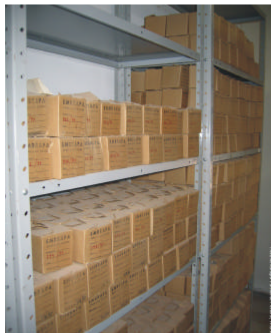
Fig. 6. Armazenamento das amostras de solo na Sala de Amostras.

Por fim, as amostras são armazenadas e estocadas na Sala de Amostras em ordem numérica e ordem subsequente anual (Fig. 6). O período de armazenamento das amostras varia de acordo com a necessidade para o caso de haver solicitação de análise e de amostras que estejam vinculadas a projetos de pesquisa de longa duração.