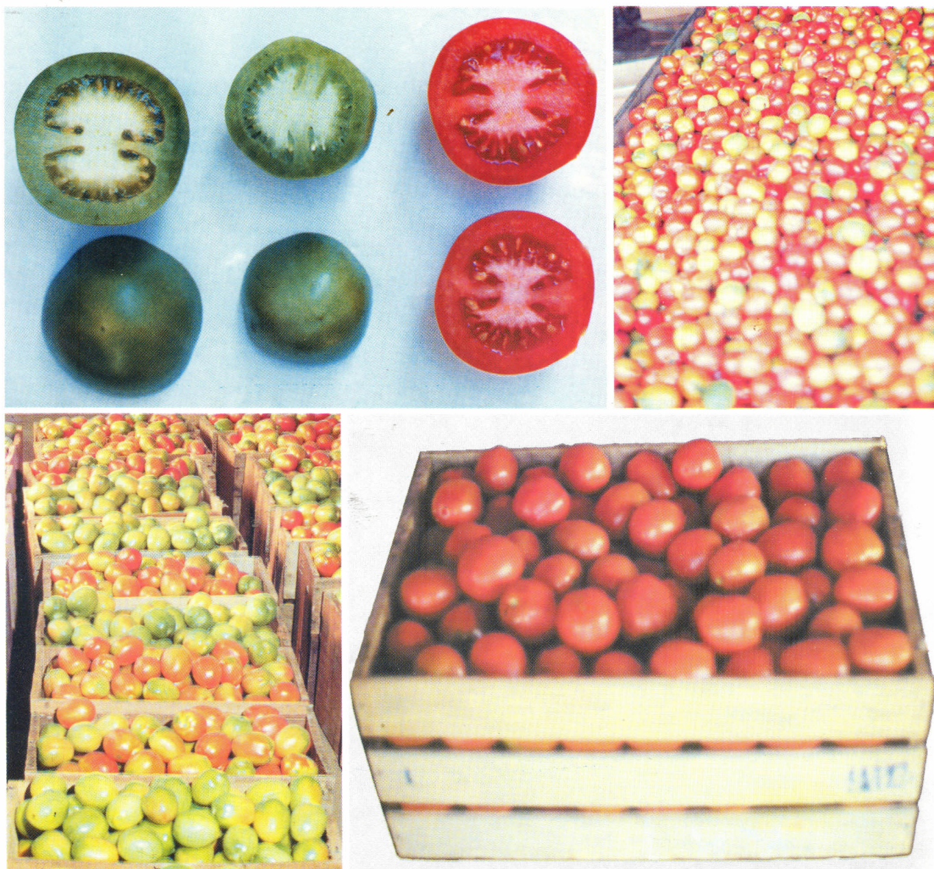
Fig. 4: Aspectos da colheita e preparo do produto: ponto de colheita, seleção, classificação e acondicionamento em caixas de madeira.

Carimbo ou rótulo na embalagem deve permitir a identificação do produto e produtor. As normas para a classificação do tomate para comercialização no mercado interno são fixadas pelo Ministério da Agricultura, que são as mesmas para exportação para os países do MERCOSUL.