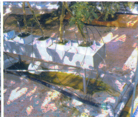
Substrato em canal