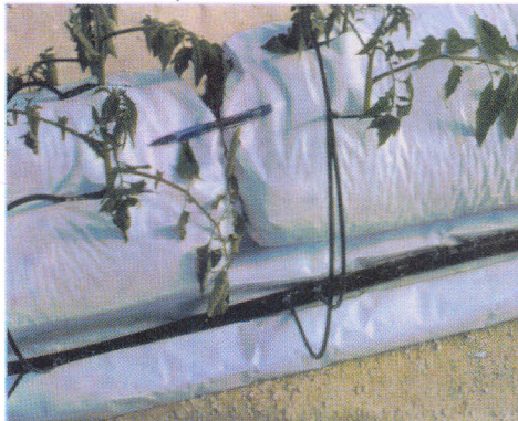
Substrato em traveseiro