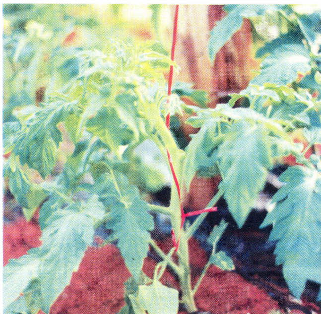
Fig. 3: Tutoramento com fitilho.