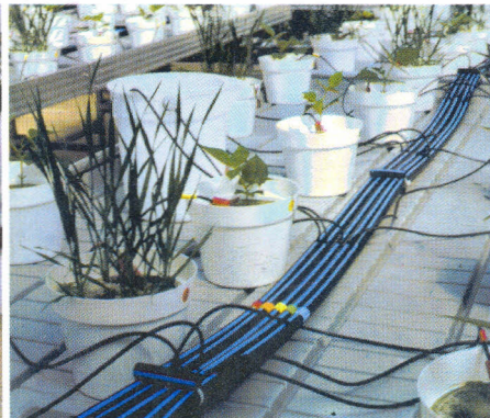
Substrato em vaso