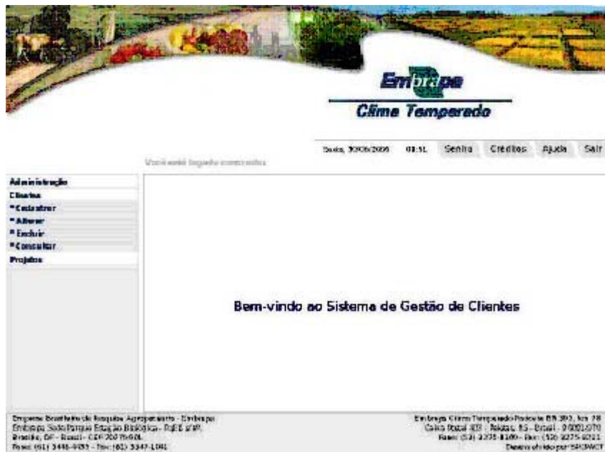
Figura1. Opções do Menu.

As funcionalidades do Sistema são apresentadas através de um Menu composto por 4 opções: Cadastrar, Alterar, Excluir e Consultar, conforme Figura1. Cada opção do Menu apresenta diferentes itens de acordo com as permissões do usuário.