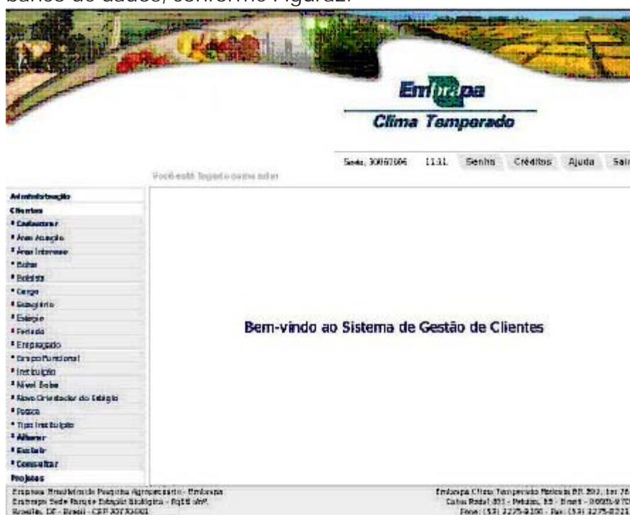
Figura 2. Opções Menu Cadastrar.

Permite incluir uma informação que ainda não foi inserida no banco de dados, conforme Figura 2.