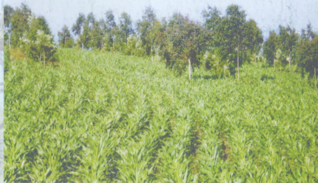
Sistemas de integração permitem produções diversificadas.