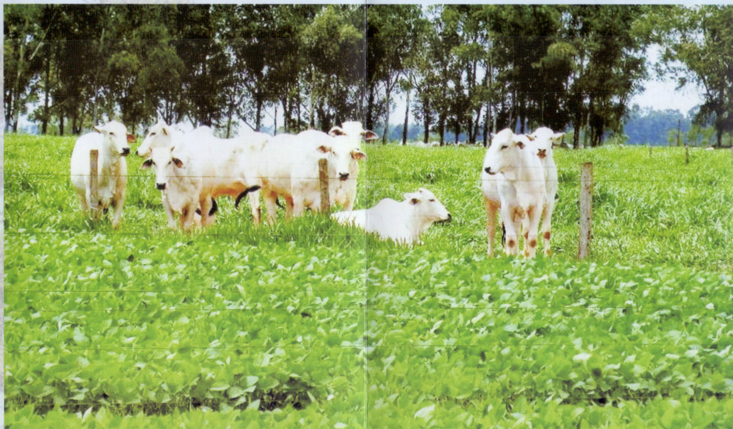
Sistema agrossilvipastoril (soja, gado de corte e eucalipto).