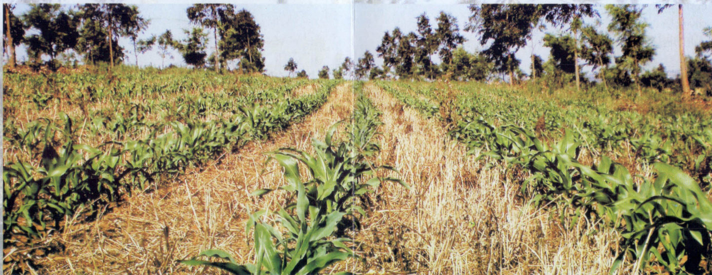
Milho em sistema plantio direto integrado à silvicultura.