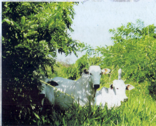
Sistema silvipastoril (gliricidia + braquiária).