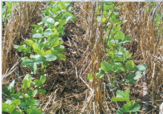
Sistema de plantio direto.

Na região Nordeste, os sistemas de iLPF predominantes são os silvipastoris, que usa principalmente a Gliricidia sepium como leguminosa, representando o componente florestal nas diversas formas de associação, e as braquiárias, como componente herbáceo. O processo inicia-se com o consórcio da leguminosa com culturas de milho e/ou feijão, repetido por 2 a 5 anos, dependendo do sistema, seguido do consórcio pasto/árvores. Em algumas áreas é utilizado o consórcio de soja e eucalipto seguido do sistema silvipastoril após o 3º ano. Nas áreas de cana, a cada 5 anos, cultivam-se leguminosas anuais (feijão de corda), na