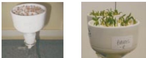
Figura 1. Sistema de cultivo adaptado para crescimento e coleta dos exsudados radiculares das plantas de sorgo

A partir do dia da transferência das sementes, o sistema deverá permanecer coberto com parafilme até que as plântulas comecem a se desenvolver e a fixar as raízes na lã de vidro, o que ocorrerá em aproximadamente três dias. Após a fixação das raízes na lã de vidro, descobrir o sistema e adicionar 50 mL de solução nutritiva com fósforo ou sem fósforo (+ P ou -P). Deve-se acompanhar o desenvolvimento, atentando-se para a umidade da lã, podendo borrifar uma quantidade de água igualmente para todos os sistemas para manter a umidade. A solução nutritiva deverá ser acrescentada de três em três dias até a véspera da coleta dos exsudados. 24 horas antes da coleta dos exsudados, deve-se retirar o parafilme que cobre a parte inferior do funil e lavar a lã de vidro com 150 mL de água destilada, utilizando uma bomba de vácuo simultaneamente para retirar toda a água e a solução anteriormente adicionada. Após essa lavagem, vedar novamente o funil com parafilme e adicionar 50 mL de solução nutritiva (+ P ou -P). Após 24 horas, retirar o parafilme e lavar a lã com 150 mL de água destilada com auxílio da bomba de vácuo. Do extrato transferido para o Kitasato, deve-se extrair os compostos radiculares liberados. Na Figura 1, pode-se ver o sistema de cultivo proposto para crescimento e coleta dos exsudados radiculares de plantas de sorgo.