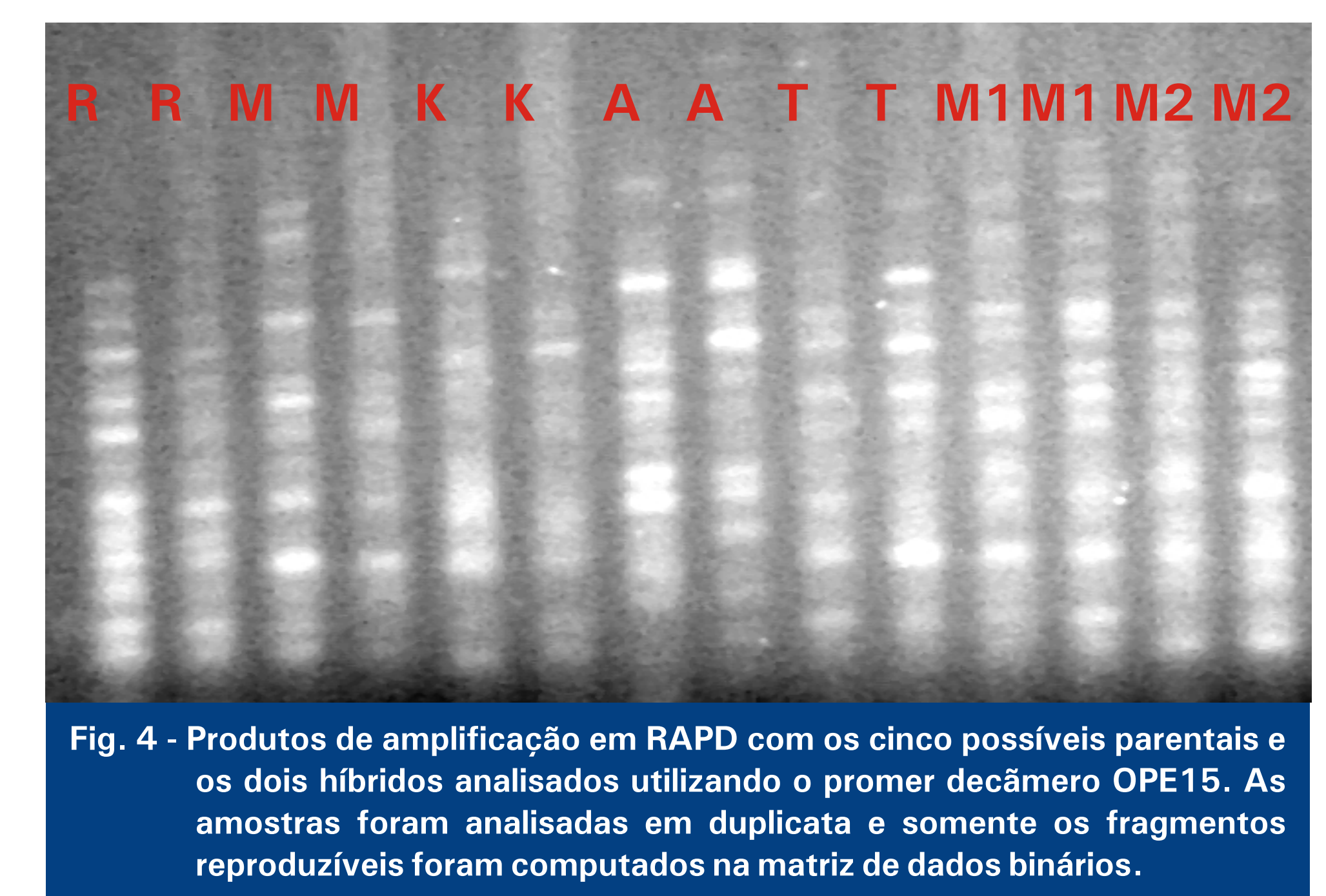
Fig. 4 - Produtos de amplificação em RAPD com os cinco possíveis parentais e os dois híbridos analisados utilizando o primer decâmico OPE15. As amostras foram analisadas em duplicata e somente os fragmentos reproduzíveis foram computados na matriz de dados binários.