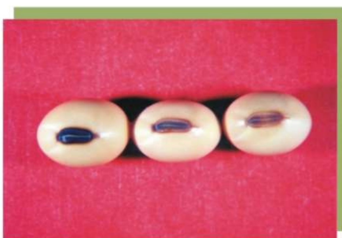
Figura 8. Alteração da cor do hilo em resposta às variações climáticas, cultivar BRS Celeste.