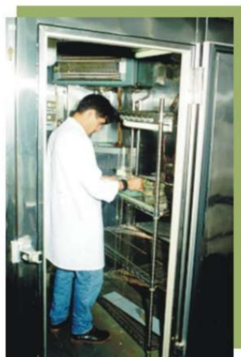
Figura 6. Laboratório de controle de pragas.