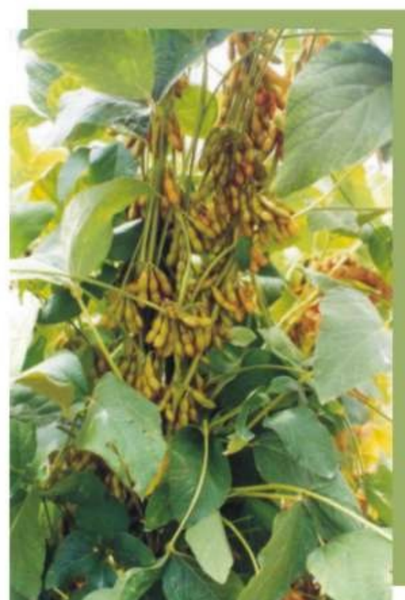
Figura 5. Material segregante de elevado potencial de produção.

Entre as principais linhas de pesquisa e desenvolvimento destacam-se a criação de cultivares de alta produtividade e estabilidade, resistência a pragas e doenças com ênfase em nematóide de cisto e ferrugem, utilização da biotecnologia na diminuição dos custos de produção e aumento da qualidade e quantidade do produto, manejo da cultura e técnicas de produção de semente de alta qualidade (Figuras 5, 6, 7, 8 e 9).