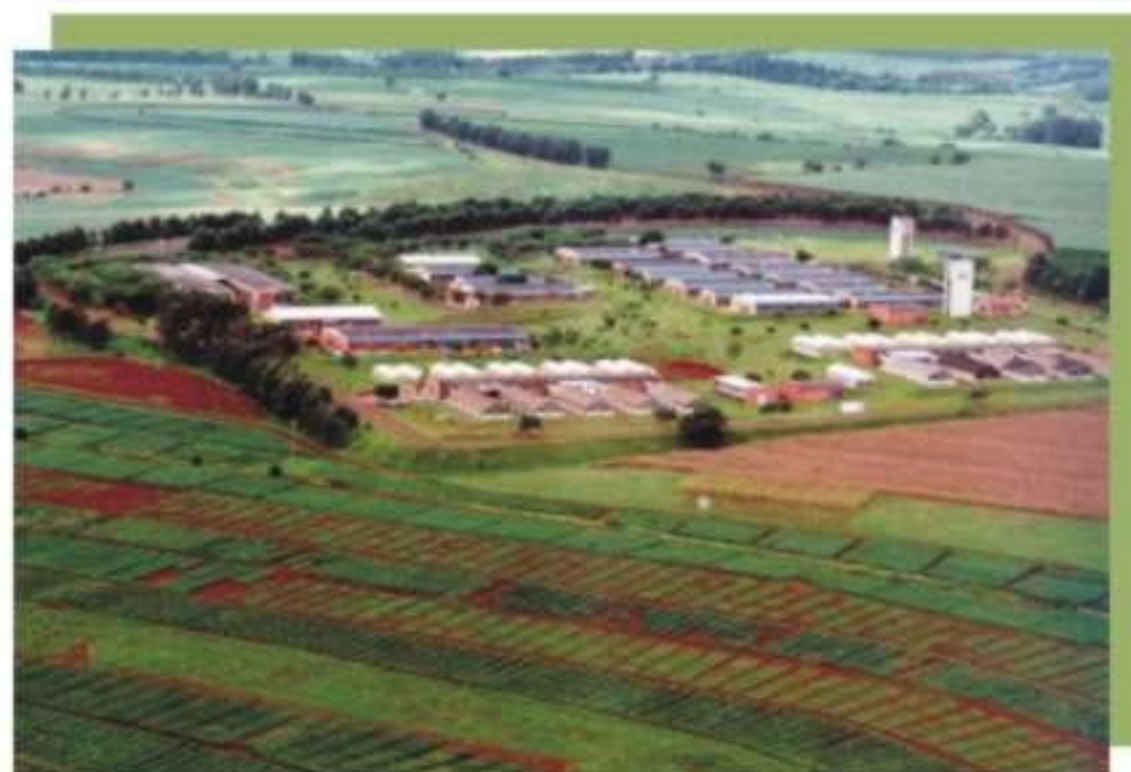
Figura 3. Vista aérea da Embrapa Soja, em Londrina, PR.