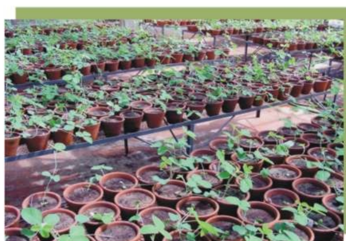
Figura 9. Pesquisa para resistência da soja ao nematóide de cisto.