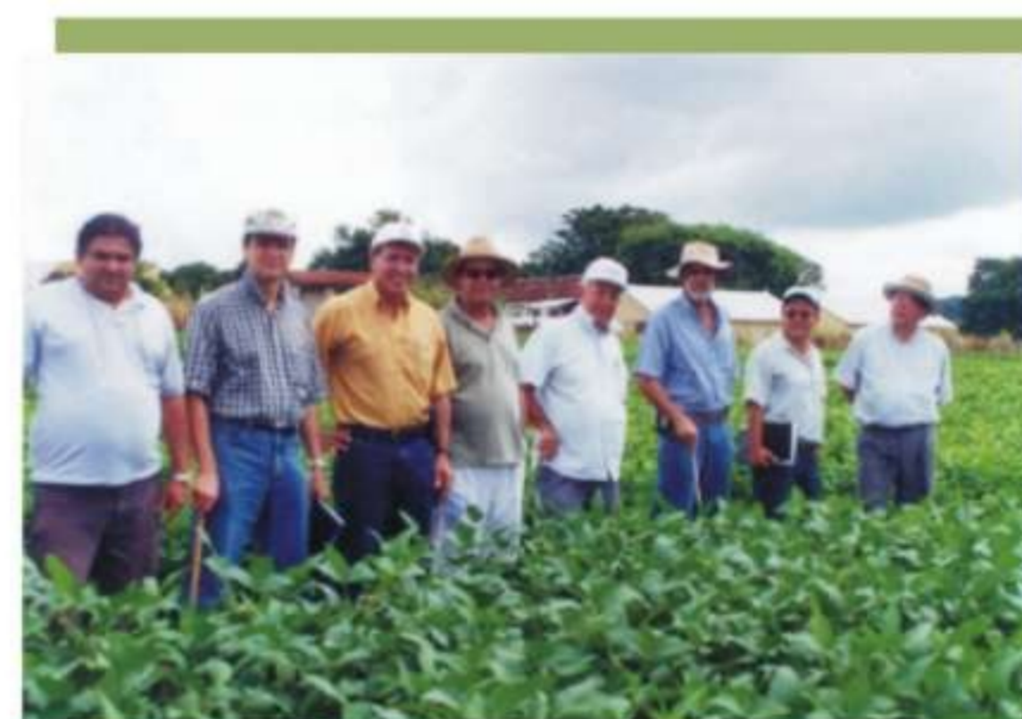
Figura 2. Pesquisadores da parceria.