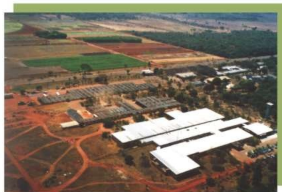
Figura 4. Vista aérea da Embrapa Cerrados, em Brasília, DF.