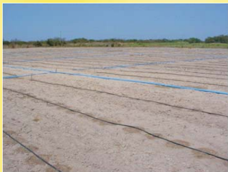
Fig. 1. Sistema de irrigação por gotejamento - fase inicial.

Recomenda-se o sistema de irrigação por gotejamento, com uma linha lateral por fileira de plantas, espaçadas de 2 m (Fig. 1 e 2). Cada linha lateral deve ser composta de um tubo de polietileno com gotejadores integrados ao tubo (in line), espaçados de 0,5 m, com vazão nominal variando de 2,0 L h -1 a 4,0 L h -1 , cuja definição depende do dimensionamento hidráulico de cada projeto específico.