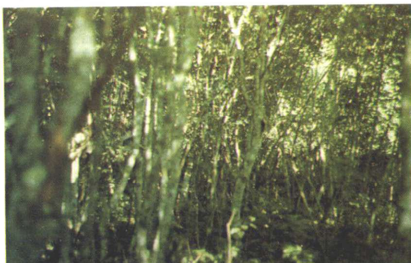
FIG.1. Aspecto do sub-bosque da capoeira estudada, em que se observa a dominância da pimenta longa.

Foi selecionada uma capoeira de 2,0 ha que se encontrava em pousio por aproximadamente dez anos, onde a população de pimenta longa era dominante (Fig.1). A população foi inventariada por meio de uma amostragem aleatória simples, tendo como unidade amostral parcelas de 10 m x 10 m. Foram instaladas 24 parcelas de 100 m 2 , correspondendo a uma intensidade amostral de 12%. Dentro de cada parcela foi contado o número de indivíduos da espécie e medida a altura das plantas, diâmetro basal, diâmetro de copa e o peso da biomassa fresca de folhas e ramos secundários.