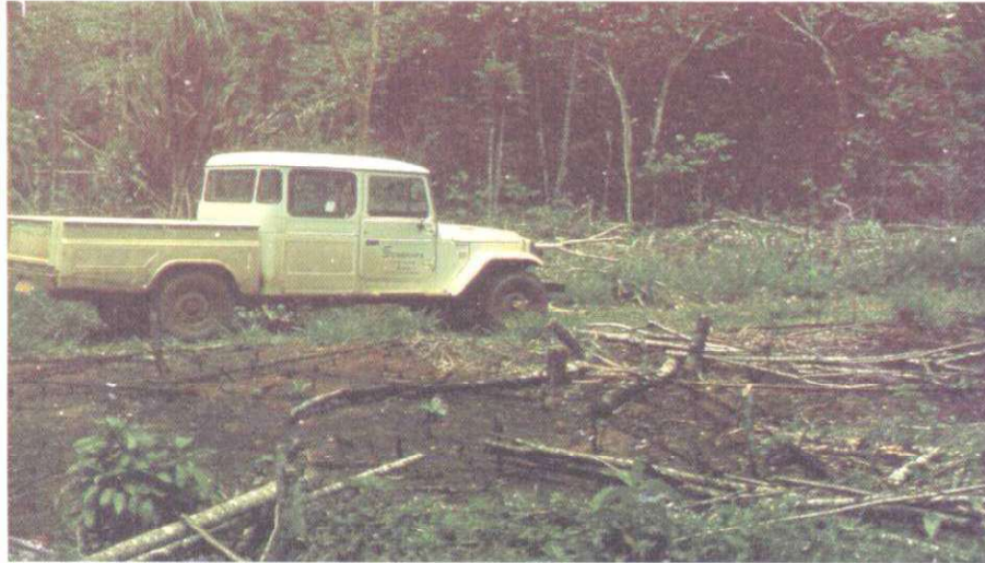
FIG. 2. Área de população nativa de pimenta longa após corte e queima.

Em algumas parcelas foi realizado o corte de toda a vegetação, observando-se, após este procedimento, uma maior presença de ervas e gramíneas competindo com as plantas de pimenta longa. Isso, a princípio, não afetou os rebrotes que são de crescimento rápido, mas na continuação do manejo poderá representar um problema para a exploração das populações nativas (Fig. 3). Estas observações estão de acordo com Finegan (1992), o qual afirma que a eliminação da vegetação pioneira simplesmente recria as condições ambientais propícias para que as espécies da primeira fase da sucessão (ervas e gramíneas) estrangulem as plantas de interesse, sendo necessário limpezas freqüentes, o que inviabilizaria o manejo por causa dos elevados custos.