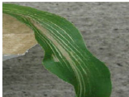
Figura 6. Sintoma de resíduo do herbicida fomesafem em planta de milho.

É muito importante conhecer a persistência média no solo dos herbicidas utilizados nas culturas antecessoras, uma vez que o acúmulo de herbicidas no solo pode tornar-se um problema para os agricultores que trabalham com culturas de sucessão. O uso de fomesafem em feijão e diclosulan na soja para o sistema de cultivo de sucessão tem causado intoxicação em plantas de milho cultivadas após estas culturas aplicadas com estes herbicidas (Figura 6).