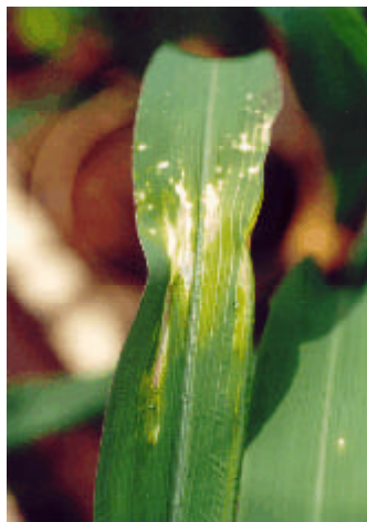
Figura 5. Sintoma de fitointoxicação do herbicida carfentrazone-ethyl em planta de milho.

Este grupo de herbicidas inibe a enzima protoporfirinogênio oxidase (Protox), que está envolvida na biossíntese da clorofila. Na presença de luz ocorre a formação de oxigênio reativo (singleto), que leva à peroxidação dos lipídios da membrana celular. Os primeiros sintomas de fitotoxicidade são manchas verde-escuras nas folhas, ocorrendo a necrose quando as plantas são expostas de 4 a 6 horas de luz solar após a aplicação (Figura 5). A morte das plantas pode ocorrer em uma semana.