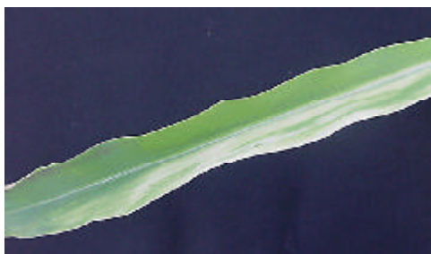
Figura 3. Sintoma de fitointoxicação do herbicida mesotrione em planta de milho.

Os herbicidas inibidores da síntese de carotenóides resultam em acúmulo de precursores sem cor do caroteno (fitoeno e fitoflueno) nas plantas. O sintoma é o branqueamento das folhas, com posterior morte das mesmas, que geralmente ocorre nas bordas e nas pontas das folhas, sendo mais evidente em folhas novas (Figura 3). Entretanto, a produção de folhas albinas não implica em que este grupo de herbicidas esteja inibindo a síntese de clorofila; isto ocorre devido à oxidação pela luz causada pela falta de carotenóides que protegem a fotoxidação.