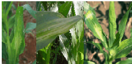
Figura 1. Sintomas de fitointoxicação do herbicida nicosulfuron em planta de milho

Este grupo de herbicidas apresenta inibição da síntese de aminoácidos essenciais (leucina, isoleucina e valina), interrompendo a síntese protéica e, assim, interferindo no crescimento celular. Os sintomas típicos de fitotoxicidade ocasionada pela aplicação de herbicidas deste grupo consistem da nescoloração da porção mediana da lâmina das folhas centrais da planta, que se encontra em fase de expansão no momento da aplicação (Figura 1).