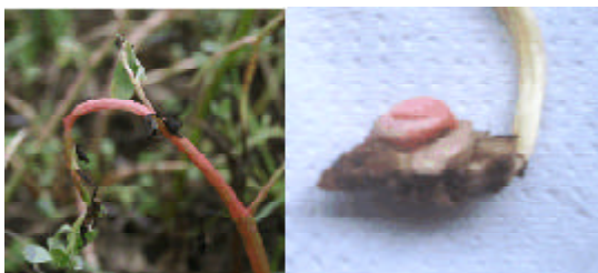
Figura 2. Sintomas típicos de fitointoxicação de herbicida mimetizadores de auxina.