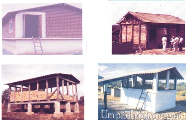
Figura 8. Diferentes tipos de paiois - uso na Agricultura Familiar.

A preferência dos produtores por colher o milho em etapas, aproveitando os intervalos de colheita de outras culturas, faz aumentar o interesse por estruturas armazenadoras que permitem realizar o expurgo do milho depois de totalmente colhido e armazenado.