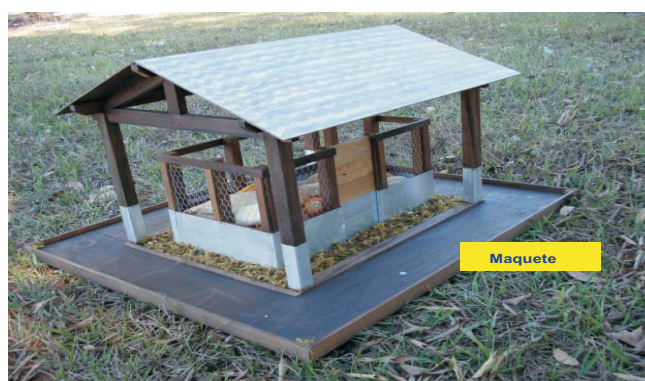
Figura 9. Paiol “Balaio de Milho”- a solução contra as pragas.

A relação de materiais e o custo estimado de construção desse paiol, nas dimensões de 4 x 3 x 2,2 metros, ou seja, 26,4 m 3 , com capacidade estimada em oito carros de milho em espiga (cerca de 8 toneladas ou aproximadamente 135 sacos), são descritos em um folder de divulgação recentemente publicado pela Embrapa Milho e Sorgo (EMBRAPA, 2006). A utilização desse modelo de paiol é a solução para o problema de pragas no milho armazenado em espiga.