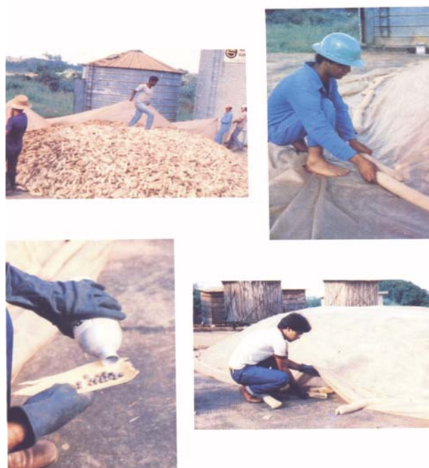
Figura 7. Expurgo das espigas com fosfina.

O expurgo com fosfina, sob lonas plásticas (Figura 7), realizado apenas uma vez, no terreiro, antes do armazenamento, reduz a menos da metade o potencial de perdas. Já o expurgo repetido a cada três meses resolve totalmente o problema do ataque de insetos. Quando o milho é armazenado em paiol comum de tábua, de tela ou de madeira roliça (Figura 8), a repetição do expurgo requer que o agricultor retire o milho do paiol, faça o expurgo e guarde-o novamente. Visando reduzir essa mão-de-obra para a movimentação do milho, foram idealizados modelos de paióis que permitem realizar a fumigação após o armazenamento.