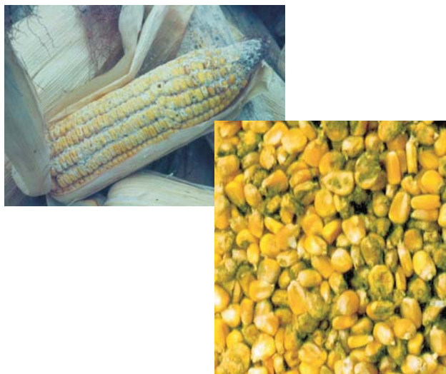
Figura 2. Espiga e grãos com danos por insetos e fungos.

Os fungos estão sempre presentes nos grãos armazenados, constituindo, juntamente com os insetos, as principais causas de deterioração e perdas constatadas durante o armazenamento (Figura 2). Os fungos são propagados por esporos, que têm nos insetos-pragas de grãos um dos principais agentes disseminadores.