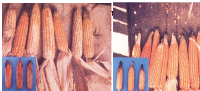
Figura 6. Danos por pragas em espigas mal(A) e bem(B) empalhadas .