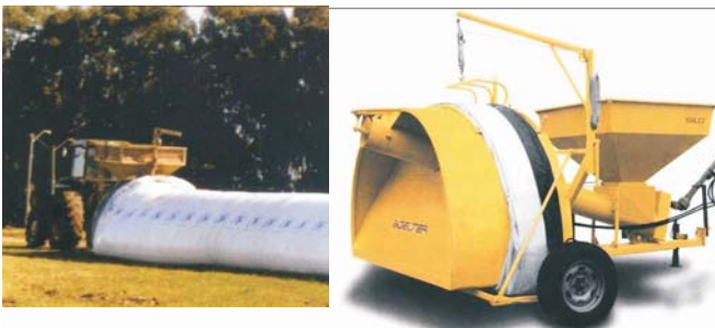
Figura 4. Armazenamento hermético em Silos “BAG”.

Armazenamento hermético: O armazenamento em ambiente hermético é também uma alternativa não química para o armazenamento de grãos secos a granel. Neste sistema não há renovação do ar, e o grão, através de sua atividade respiratória, consome todo o oxigênio disponível. Na ausência de oxigênio os insetos não sobreviverão e os fungos não se multiplicarão e, portanto, não haverá nenhum dano aos grãos durante todo o período de armazenagem. O mercado hoje oferece um produto chamado “SILO BAG ® ” (Figura 4) que é constituído de uma máquina para transporte de grãos e uma bolsa plástica que fecha muito bem, criando um ambiente hermético .