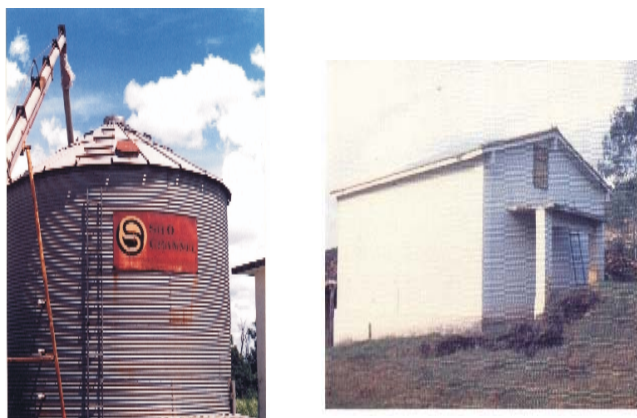
Figura 3. Silos para armazenagem na propriedade familiar.

O expurgo com fosfina, na dose recomendada na Tabela 9, é um método de comprovada eficiência para se controlar os insetos no milho armazenado a granel. O expurgo é um método eficiente e barato, porém deve ser praticado somente por pessoas habilitadas, em ambientes herméticos, para não ocorrer escapamento de gás durante a operação.