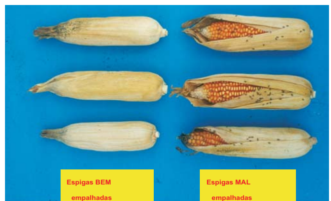
Figura 5. Proteção dos grãos pela cobertura da espiga.

d) o bom empalhamento (Figura 5) da espiga atua como uma proteção natural dos grãos contra as pragas enquanto que o mal empalhamento favorece o ataque de pragas (Figura 6).