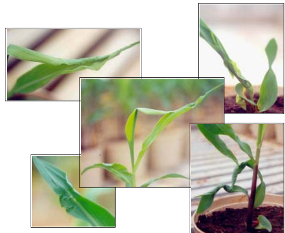
Figura 2. Plantas novas de milho apresentando efeito fitotóxico do herbicida s-metolachlor. Embrapa Milho e Sorgo, Sete Lagoas, MG. 2002

O efeito fitotóxico desse grupo de herbicida pode ser observado após a germinação das plântulas, caracterizando-se pela não abertura do coleótilo e pelo enrugamento das folhas definitivas, causado pelo menor crescimento da nervura central em relação ao crescimento do limbo foliar (Figura 2).