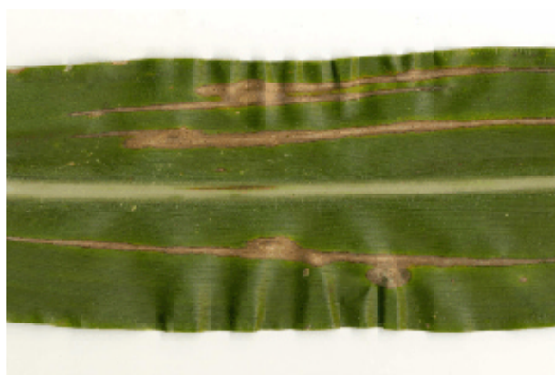
Figura 1. Lesões foliares causadas por Stenocarpella macrospora , mostrando pontos de infecção do fungo.

A avaliação sintomatológica de S. macrospora nas folhas foi realizada aos 120 dias após a semeadura (estádio de grãos pastosos), empregando-se escala de notas de 0 a 5: 0= ausência de lesões; 1= lesões esparsas; 2= lesões em 50% das folhas e com 25% de severidade; 3= lesões em 75% das folhas e com 50% de severidade; 4= lesões em 100% das folhas e com 75% de severidade; e 5= lesões em 100% das folhas e com seca total das plantas.