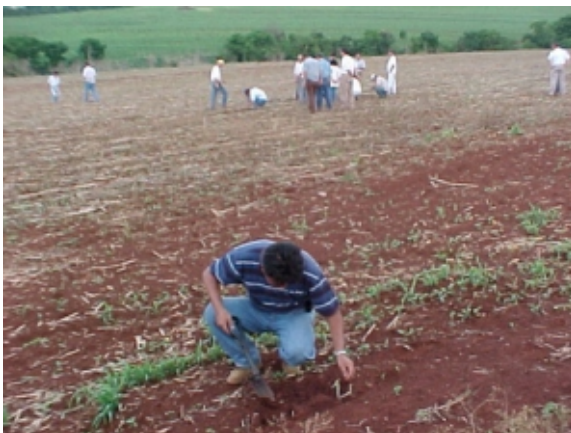
FIG. 1. Lavoura de soja com sintomas de baixas germinação e emergência de plântulas. Foto: J.T. Yorinori. Embrapa Soja, Londrina, PR. 2000.