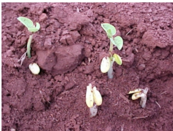
FIG. 6. Plântulas de soja, que devido ao drástico engrossamento e encurtamento dos hipocótilos, não conseguiram emergir os seus cotilédones. Como consequência ocorreu estiolamento dos epicótilos. Foto: J.T. Yorinori. Embrapa Soja, Londrina, PR. 2000.