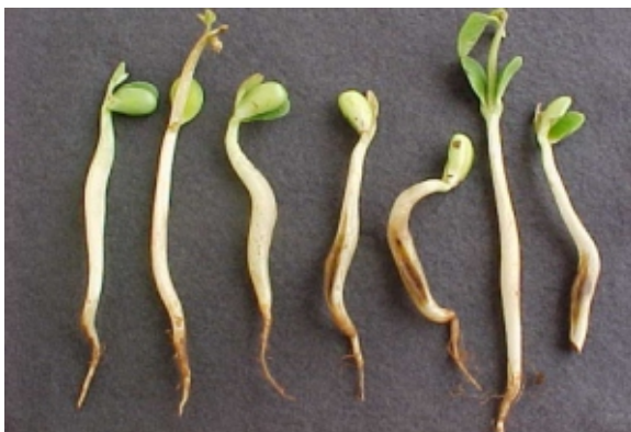
FIG. 4. Plântulas de soja com sintomas de engrossamento de hipocótilo e com fissuras longitudinais. Foto: J.B. França Neto. Embrapa Soja, Londrina, PR. 2000.