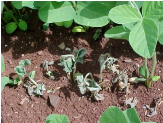
FIG. 10. Tombamento por Sclerotium rolfii . Foto: J.T. Yorinori. Embrapa Soja, Londrina, PR. 2000.