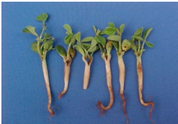
FIG. 5. Plântulas de soja com sintomas de engrossamento e encurtamento dos hipocótilos, alguns deles mostrando acentuada fissura longitudinal. Note a presença de multi-brotamentos nos nós cotilédones. Foto: J.B. França Neto. Embrapa Soja, Londrina, PR. 2000.