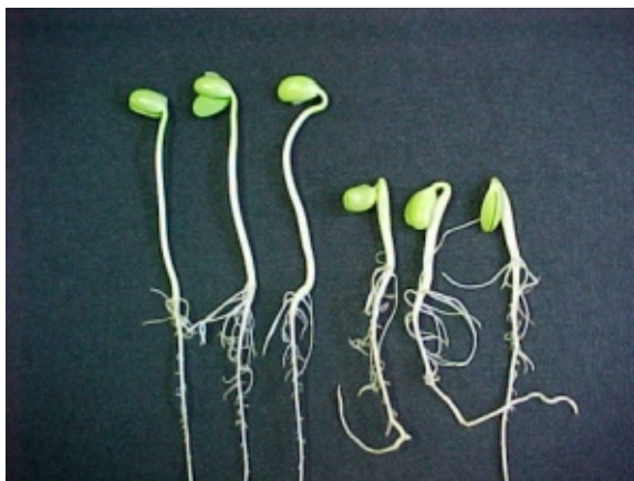
FIG. 8. A esquerda: plântulas sem sintomas de fitotoxicidade; à direita: plântulas com sintomas de encurtamento e engrossamento de hipocótilos. Foto: J.B. França Neto. Embrapa Soja, Londrina, PR. 2000.