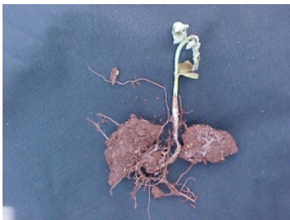
FIG. 11. Crescimento do fungo no solo e na parte afetada da raiz. Foto: J.T. Yorinori. Embrapa Soja, Londrina, PR. 2000.