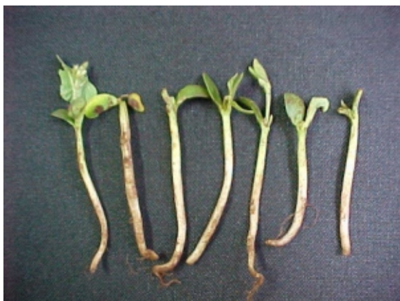
FIG. 2. Sintoma de engrossamento de hipocótilo. Foto J.B. França Neto. Embrapa Soja, Londrina, PR. 2000.