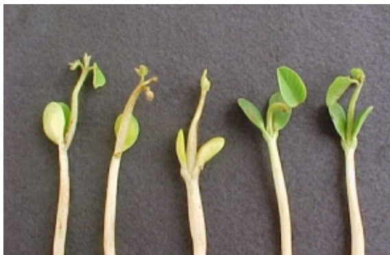
FIG. 7. Plântulas de soja com sintomas típicos de estiolamento de epicótilo. Foto: J.B. França Neto. Embrapa Soja, Londrina, PR. 2000.