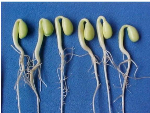
FIG. 3. Sintoma típico de engrossamento e encurtamento de hipocótilos. Foto: J.B. França Neto. Embrapa Soja, Londrina, PR. 2000.