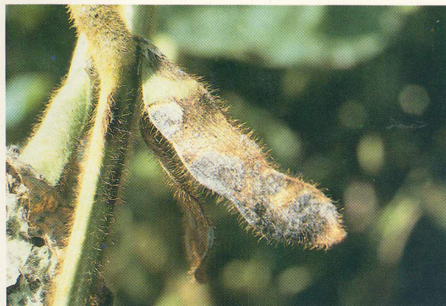
FIG. 6: Manchas nas vagens.