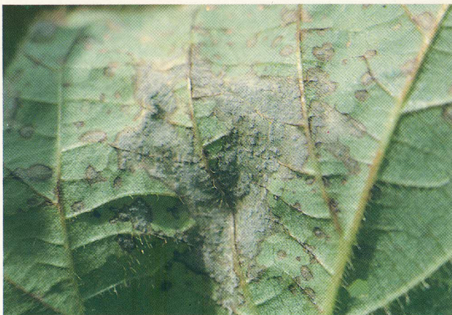
FIG. 4: Coalescência de várias manchas, com abundante esporulação; face inferior da folha.

Nas vagens (Figs. 5 e 6) e hastes (Fig. 7), as manchas surgem próximo à fase de granação máxima, anterior à fase inicial de maturação. Inicialmente, surgem manchas que variam de pontuações castanho-avermelhadas a manchas de encharcamento medindo, em média, de 3mm a 5mm de diâmetro. Essas manchas evoluem da coloração cinza-claro a cinza-escuro para castanho-claro a castanho-escuro, com margem castanho-avermelhada. Enquanto as manchas estiverem esporulando, seu centro permanece com coloração cinza.