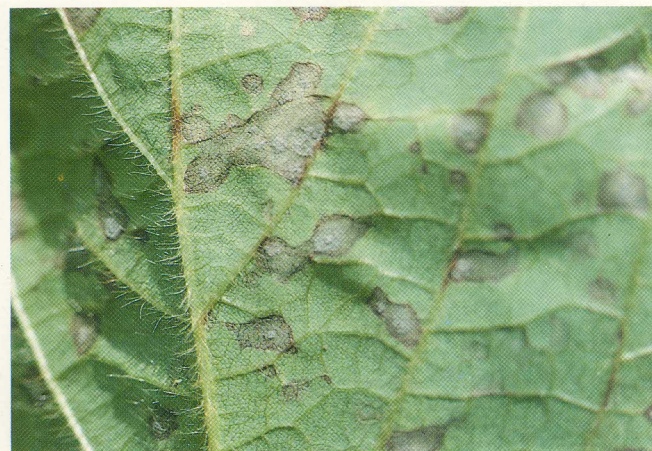
FIG. 3: Mancha "olho-de-rã" em fase inicial, com esporulação; face inferior da folha.