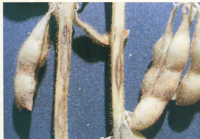
FIG. 7: Manchas nas hastes.