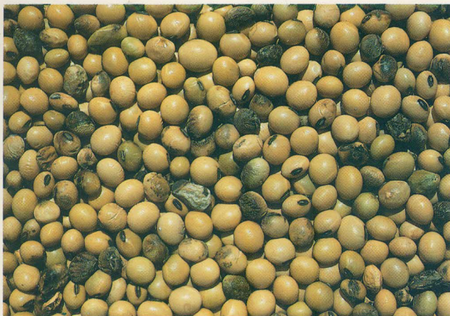
FIG. 8: Grãos podres, de lavoura altamente infectada.