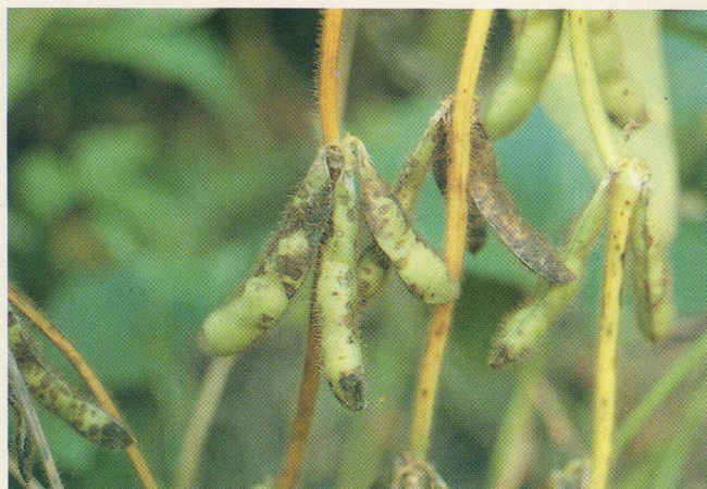
FIG. 5: Manchas nas vagens.

A introdução do fungo em áreas novas é feita principalmente pela sementeira de cultivares suscetíveis, colhidas de áreas infectadas. Durante a germinação, o fungo esporula no tegumento que emerge colado ao cotilédone e os esporos (Fig. 10) são disseminados na lavoura e a longas distâncias pelo vento. Uma vez introduzido na área, o fungo sobrevive de uma safra para outra nos restos de cultura.