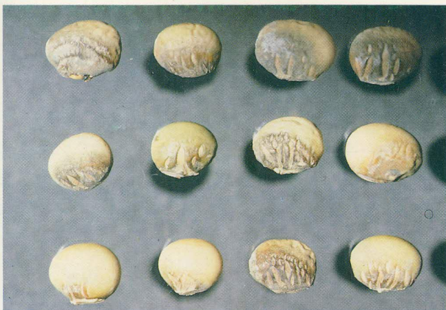
FIG. 9: Sementes infectadas, com rachaduras no tegumento.