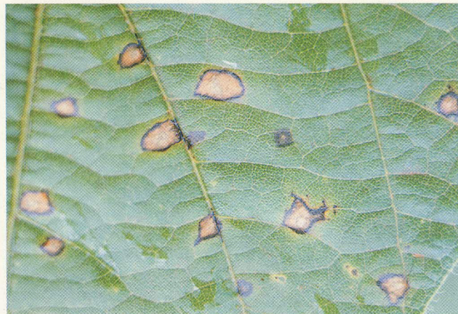
FIG. 2: Mancha de "olho-de-rã" típica, completamente desenvolvida; face superior da folha.