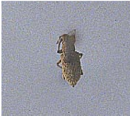
Fig. 3. Adulto de Plectrophoroides incertus Voss, 1990, coletado em cajueiro.