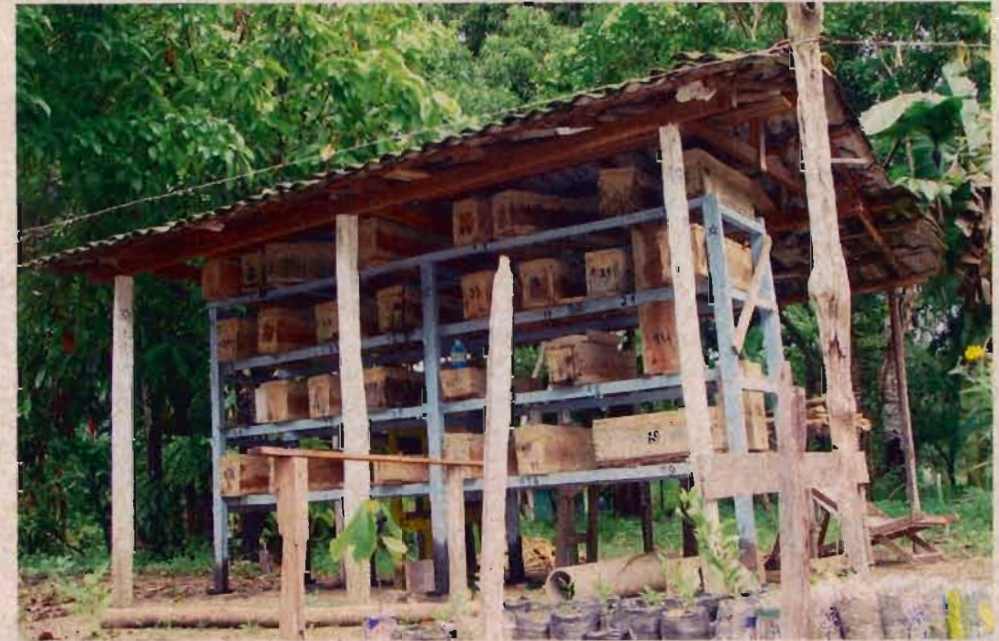
Meliponário tradicional de Melipona flavolineata na propriedade do Sr. Raimundo Lima em Igarapé-Açu.

Foram instalados meliponários utilizando-se caixas racionais na propriedade agrícola. No curso de capacitação o meliponário instalado foi utilizado para ministrar as aulas práticas. Amostras de méis produzidos na unidade estão sendo coletados para serem feitos estudos sobre as propriedades físico-químicas.