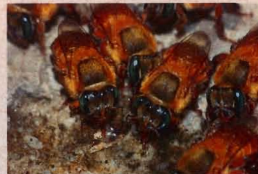
Operárias de Melipona flavolineata .