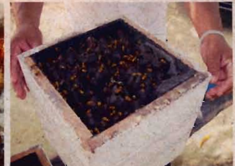
Melgueira de Melipona flavolineata .

Mais informações no site http://mel.cpatu.embrapa.br