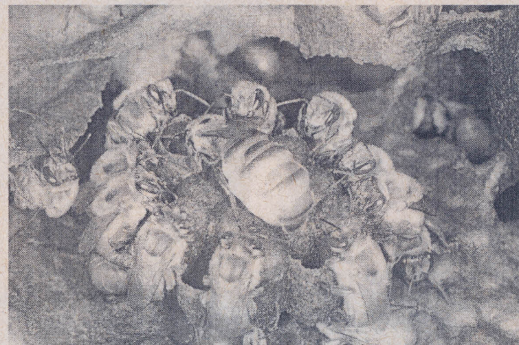
Rainha e operárias no momento da postura

Foi instalado um meliponário utilizando-se caixas racionais na propriedade agrícola. Nos cursos de capacitação o meliponário instalado foi utilizado para ministrar as aulas práticas, ilustrando o modelo proposto, biologia e diversidade das abelhas nativas da Amazônia Oriental. Foram produzidas mudas de plantas apícolas para enriquecimento do pasto apícola no entorno da unidade demonstrativa e para doação aos criadores comunitários em diversos municípios paraenses atendidos pelo projeto.