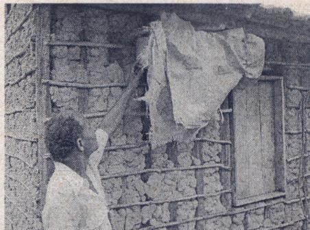
Abelha Uruçu Amarela em entrada de ninho