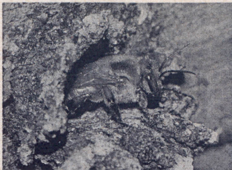
Caixa Cabocla em residência de agricultor

Divulgação de tecnologias ligadas a meliponicultura junto a comunidades agrícolas de base familiar, estudantes, pesquisadores e professores sobre meliponicultura.