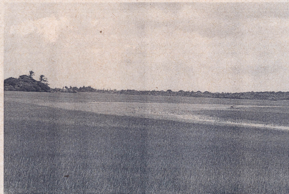
Vista dos Campos de Bragança

Foi instalado um meliponário utilizando-se caixas racionais na propriedade agrícola. No curso de capacitação o meliponário instalado foi utilizado para ministrar as aulas práticas, ilustrando o modelo proposto, biologia e diversidade das abelhas nativas da Amazônia Oriental. Foram doadas mudas de plantas apícolas para enriquecimento do pasto apícola no entorno da unidade demonstrativa. Amostras de méis, pólen, cerume e batume, produzidos na unidade demonstrativa estão sendo coletados para serem feitos estudos sobre as propriedades físico-químicas das diversas abelhas nativas sem ferrão da Amazônia.