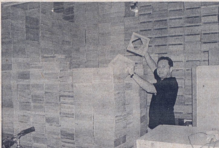
Caixas racionais de criação para distribuição ente os agricultores parceiros do projeto

Divulgação de tecnologias ligadas a meliponicultura junto a comunidades agrícolas de base familiar sobre meliponicultura.