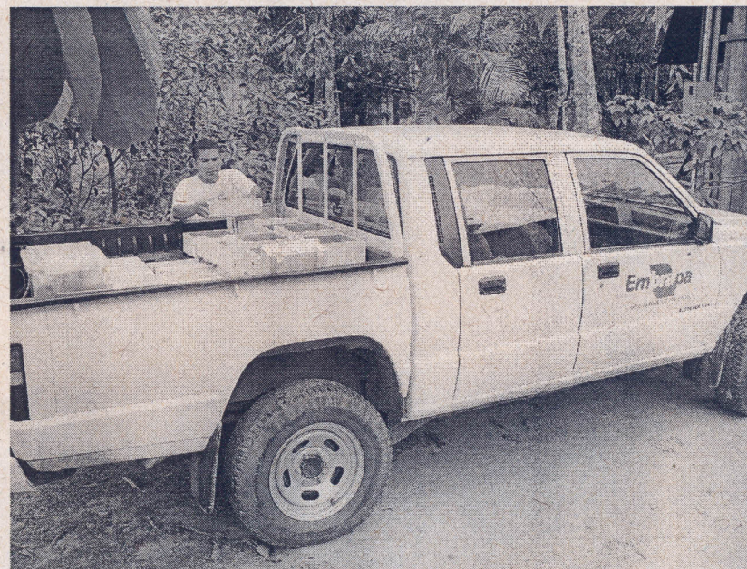
Caixas produzidas na própria comunidade

Foi instalado um meliponário utilizando-se caixas racionais na propriedade agrícola. Nos cursos de capacitação o meliponário instalado foi utilizado para ministrar as aulas práticas, ilustrando o modelo proposto, biologia e diversidade das abelhas nativas da Amazônia Oriental. Foram produzidas mudas de plantas apícolas para enriquecimento do pasto apícola no entorno da unidade demonstrativa e para doação aos criadores comunitários em diversos municípios paraenses atendidos pelo projeto.