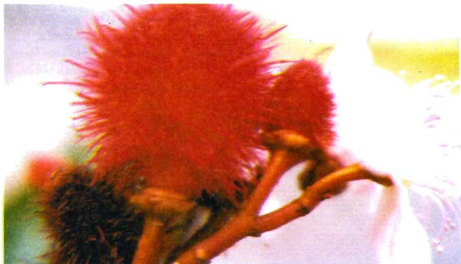
Fig. 6. Fruto de urucuzeiro da variedade Vermelho Cpatu-01.