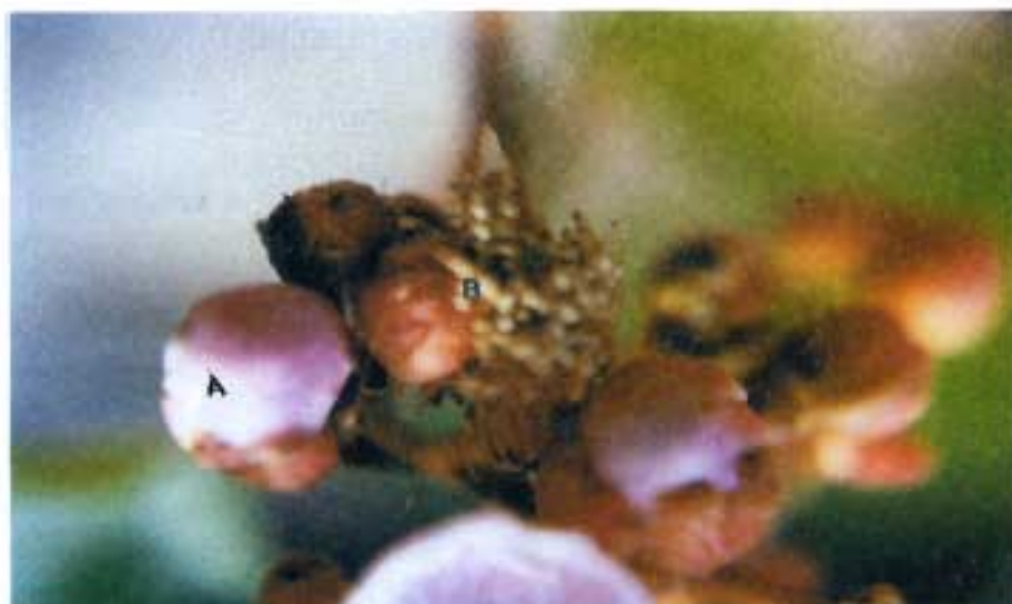
Fig. 3. Botões florais em pré-antese (A) e flor pós-antese observando-se o início da queda dos estames (B).