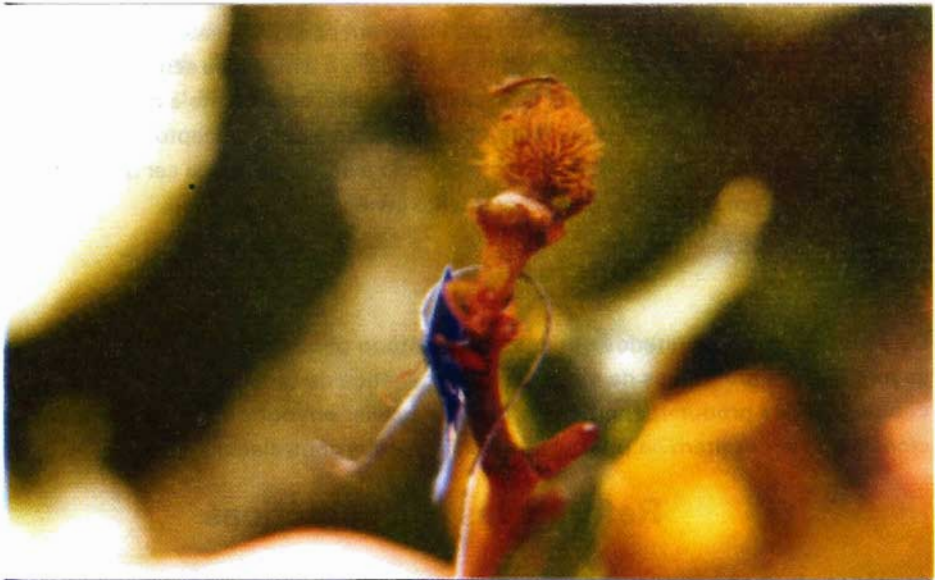
Fig. 9. Ovário em desenvolvimento, uma semana após a polinização controlada.