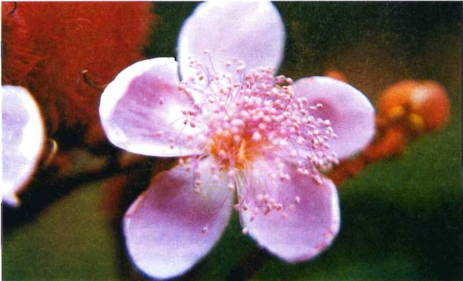
Fig. 5. Flor de urucuzeiro aberto exibindo seus órgãos reprodutivos em antese.

A flor aberta, (Fig. 5) apresenta as pétalas totalmente separadas e voltadas para a base do pedicelo e a coloração pode ser roseo clara a branca, conforme a variedade. Os estames apresentam-se totalmente separados, dispostos em forma de "bouquet", os filetes são longos, amarelados na base e rosa-avermelhados, com deiscência poricida e liberando pólen. O estilete apresenta-se ereto, acima dos estames. Neste estágio os aparelhos reprodutores funcionais são estigma aberto e receptivo. A polinização ocorre nesta fase.