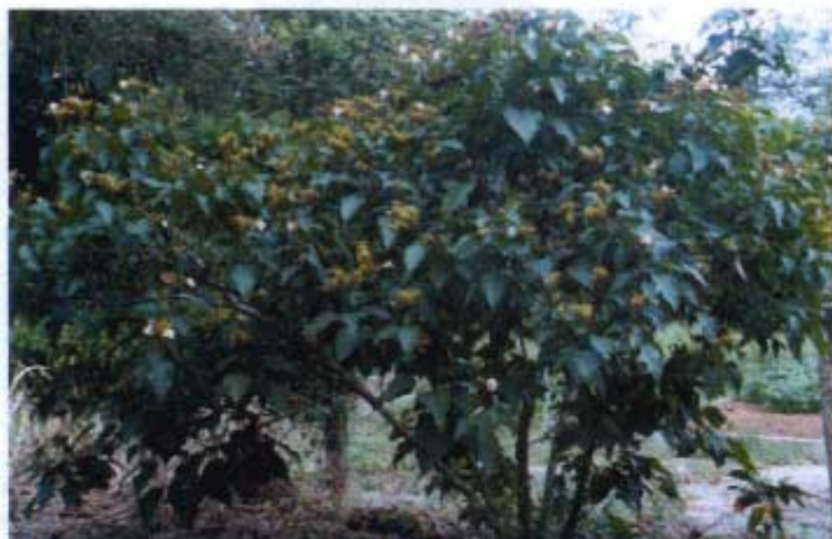
Fig. 1. Urucuzeiro variedade Peruana CPATU.