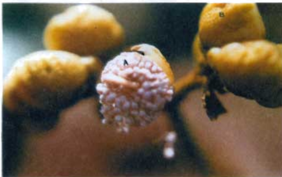
Fig. 4. Botão floral em pré-antese mostrando estames agrupados, estilete e estigma recurvados (A), botão floral protegido pelas sépalas (B).