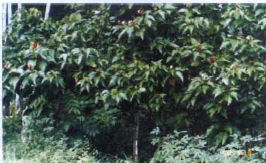
Fig. 2. Urucuzeiro variedade Vermelha CPATU-01.