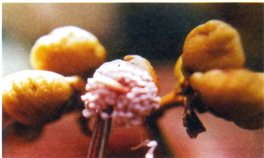
Fig. 8. Emasculação em botão floral em pré-antese.