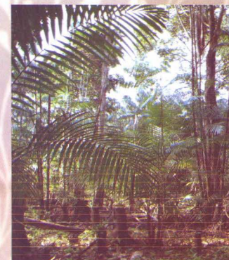
açazal manejado, mantendo-se as árvores de interesse

1. Escolha da área para o manejo – Para a escolha, foram considerados fatores como a proximidade entre o açazal e a casa do agricultor, o respeito às margens dos igarapés (áreas de preservação permanente – APPs), e se a área era de várzea ou de terra firme. Após a escolha, foi feita uma limpeza inicial da área para facilitar as atividades que iam acontecer.