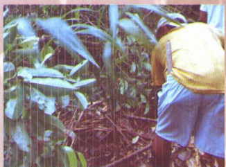
plantio de mudas para correção do espaçamento