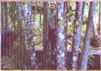
marcação para o manejo da touceira