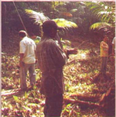
correção do espaçamento