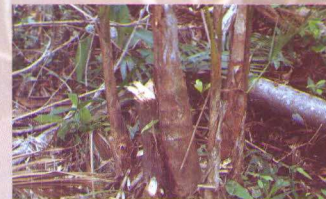
touceira de açai manejada