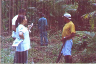
escolha da área

Após este planejamento inicial, partiu-se para a ação, ou seja, para o manejo dos açazais. De maneira geral, ele aconteceu obedecendo-se os seguintes passos: