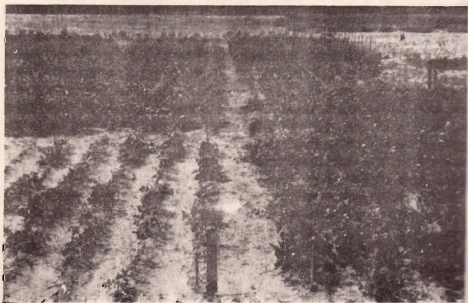
Vista geral do Experimento de Adubação, notando-se a parcela Testemunha.