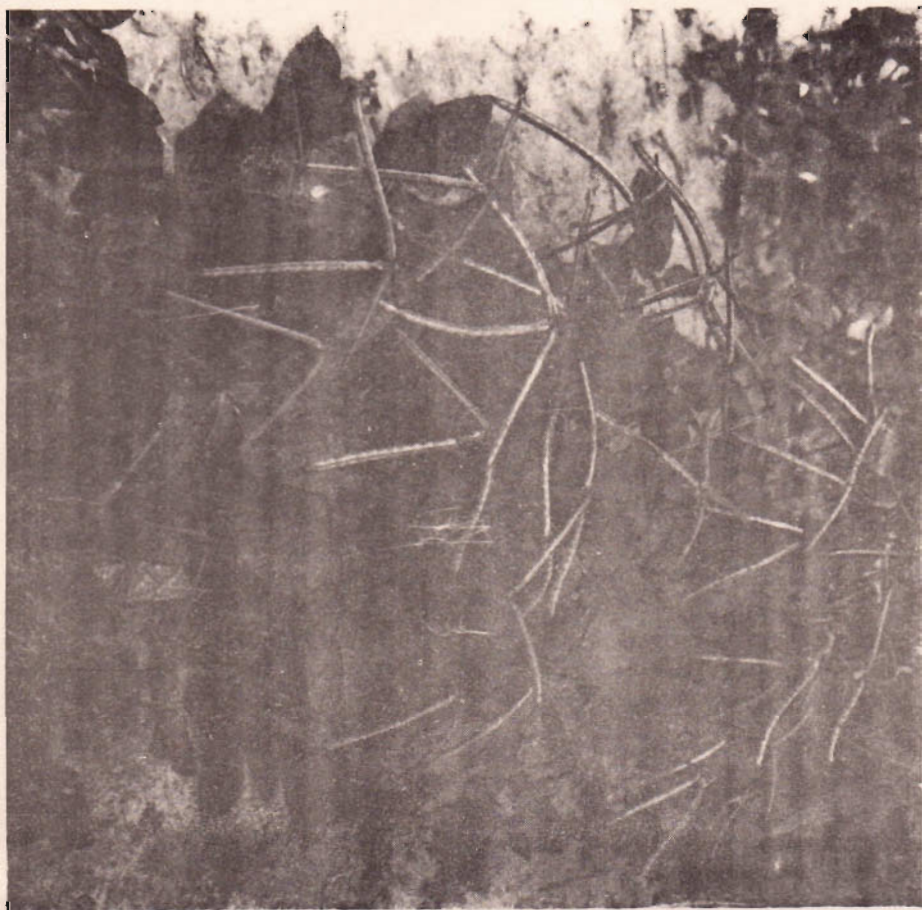
Aspecto da Variedade Malhado