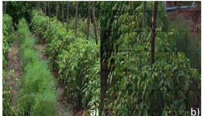
Figura 1. a) Tomateiro em consórcio com erva-doce. b) Barreiras vivas com feijão guandu e abacaxi na área de cultivo.