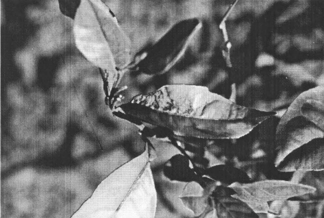
Fig. 1. Galerias espiraladas em forma de serpentinhas na face abaxial da folha.