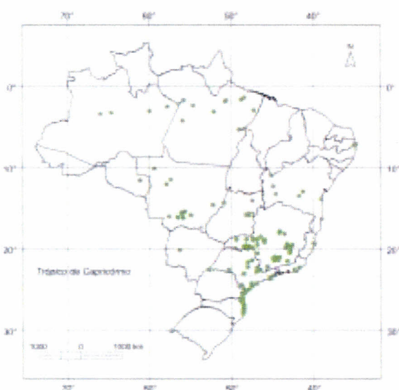
Mapa 1. Locais identificados de ocorrência natural de guanandi ( Calophyllum brasiliense ), no Brasil.

No Brasil, essa espécie ocorre nos seguintes Estados (Mapa 1):