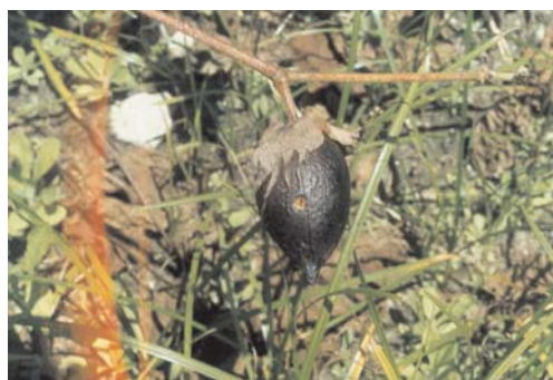
Fig. 4. Dano causado pelos fungos no fruto do algodão. Detalhe de um ponto de colonização do patógeno.

As aflatoxinas são compostos químicos que se formam no algodão em caroço durante o desenvolvimento das sementes e depois da abertura dos frutos do algodoeiro (ICAC Recorder, 1999), estando como foi dito anteriormente associados ao ataque da lagarta rosada e produzido pelo fungo A. flavus ; sendo que o nível nas sementes não pode ultrapassar 10 mg/kg (Lee & Goldblatt, 1981), tendo vários tipos denominados de B 1 , B 2 , G 1 e G 2 . Ciegler et al. (1981) citados por Cherry & Leffler (1984) identificaram vários tipos de aflatoxinas e suas estruturas químicas, sendo que as mais comuns são as retromencionadas cujas fórmulas estruturais podem ser vistas na Figura 5. As aflatoxinas causam necroses no fígado, infiltrações de lipídeos e outros distúrbios em vários órgãos de suínos, equíneos, bovinos e outros (Cherry & Leffler, 1984). A umidade do algodão em caroço e a umidade relativa do ar são os