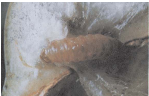
Fig. 3. Maçã do algodoeiro danificada pela lagarta rosada.

& Brown (1975) cancerígenas. Na Figura 4, pode ser vista parte de um fruto com a colonização de fungos no orifício deixado pela lagarta rosada. Quando as fibras são intimamente manchadas elas recebem a classificação comercial de manchadas, representadas pelos tipos 6 MAN, 6/7 MAN e 7 MAN. A sigla MAN, refere-se ao algodão manchado (Santana & Beltrão, 1999).