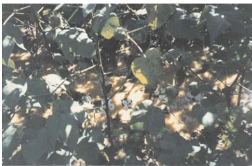
Fig. 2. Algodão próximo da colheita, com excesso de umidade, com as sementes nos capulhos iniciando a germinação. Sapezal, MT.

Um dos problemas sérios que reduz qualidade global do algodão, fibra e sementes, é o ataque da lagarta rosada ( Pectinophora gossypiella , Saunders, 1844), inseto da ordem lepdoptera, família gelechiidae que ataca o algodoeiro promovendo a imbricação das flores formando uma roseta e nas maçãs a parede do carpelo ficam com galerias, minas ou verrugas e as fibras, de uma ou mais lojas, ficam manchadas ou destruídas e as sementes total ou parcialmente destruídas (Almeida & Silva, 1999), como pode ser visto na Figura 3, sendo que a larva pode ficar em diapausa por até 23 meses e a semente do algodoeiro é o maior veículo de disseminação desta praga, que teve origem possivelmente na Índia e chegou em São Paulo, pela primeira vez no Brasil em 1918 em sementes importadas do Egito, (Passos, 1977).