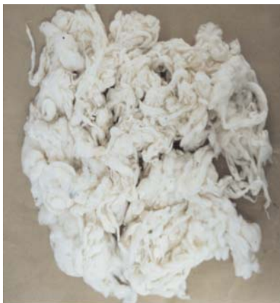
Fig. 1. Algodão em fibra, encarneirado, com a qualidade comprometida.

Além dos problemas anteriormente colocados, a umidade excessiva no final do ciclo da cultura, quando os frutos iniciam a abertura, pode trazer outros problemas que prejudicam a fibra e também a qualidade da semente, quanto seu uso para plantio, no caso de sementes básicas e/ou fiscalizadas, quanto de caroço, a ser usada na alimentação do homem (cultivares "glandless" ou derivados da semente, após a retirada do gossipol) e animal, "in natura" para ruminantes ou produtos manufaturados, com rações, tortas, etc.