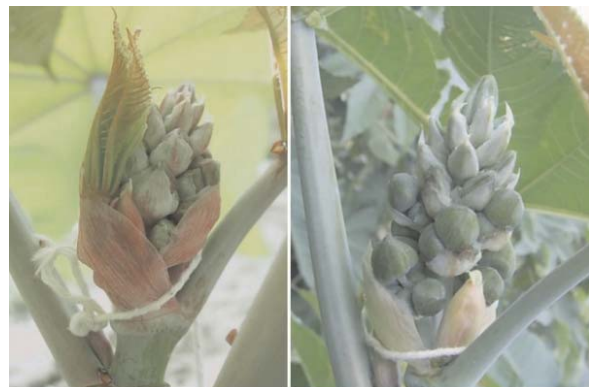
Fig. 5. Inflorescência protegida por uma folha e duas brácteas logo após o surgimento (esquerda) e poucos dias depois (direita).

O número de flores e sua proporção é outra característica que depende das condições ambientais. De forma geral, se no momento do