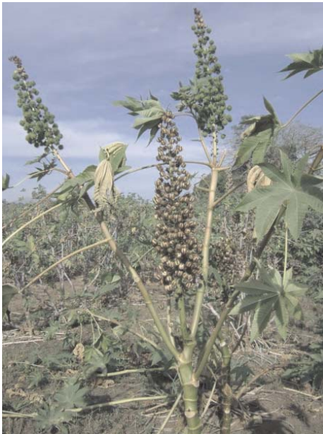
Fig. 1. Planta da cultivar IAC 80 com cacho primário já seco, secundário verde e início do crescimento dos ramos terciários.

Na planta apresentada na Figura 1 (cultivar IAC-80), observa-se a formação de um cacho primário já completamente seco e de dois cachos secundários ainda imaturos. Nota-se também que surgem ramos terciários logo abaixo do nó de inserção dos racemos secundários.