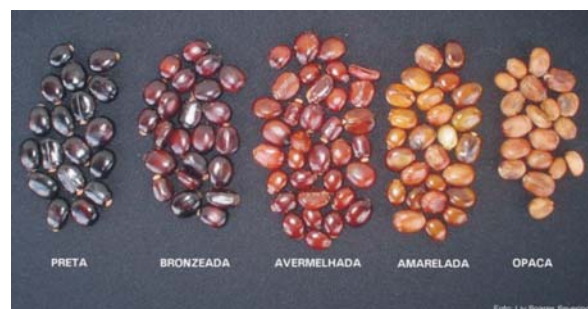
Fig. 10. Escala de cores do tegumento de sementes de mamona (preta).

Numa amostra de mamona já colhida e descascada podem ser encontradas sementes com diferentes cores de tegumento, as quais foram divididas em cinco classes ((Fig. 10). Quando se faz a colheita de cachos contendo muitos frutos verdes, aumenta a freqüência de sementes com tegumento de coloração mais clara, as quais são mais leves e possuem menos óleo (LUCENA et al., 2006). Enquanto uma semente com tegumento preto pesa 0,85 g e tem 48,48% de óleo, uma semente amarelada pesa apenas 0,43 g e tem 39,9% de óleo (Tabela 1). Em outras cultivares, a cor do tegumento da semente pode ser diferente, mas essa descoloração também ocorre. Nesse caso, a visualização exige mais atenção, principalmente naqueles tegumentos cuja cor normal é clara.