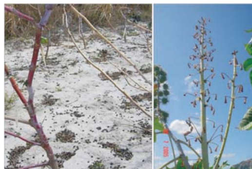
Fig. 11. Exemplo de sementes caídas no chão devido à abertura dos frutos (esquerda) e cacho de mamona em que todos os frutos se abriram antes que pudessem ser colhidos (direita).

Quando os frutos secam, o agricultor precisa decidir o momento ideal de colheita. Como essa operação utiliza grande quantidade de mão-de-obra e pode encarecer os custos de produção, é preciso que se faça o menor número possível de passagens na lavoura. Por outro lado, não se pode deixar que os frutos se abram, pois coletar as sementes no chão é muito mais caro e compromete a qualidade do óleo. Na Figura 11, observam sementes caídas no solo por causa da abertura dos frutos e um cacho em que todos os frutos se abriram, perdendo-se a produção.