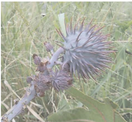
Fig. 2. Cacho de mamona da cultivar BRS Paraguaçu com apenas um fruto.

Este período de três meses refere-se aos cachos considerados para a colheita, pois na verdade a planta produz novos cachos continuamente. No entanto, a tendência é que à medida que a planta envelhece os racemos sejam cada vez menores, podendo haver numerosos cachos com poucos frutos (Fig. 2). Como estes últimos cachos, além de pequenos, estão posicionados mais alto devido ao crescimento da planta, sua colheita é economicamente inviável.