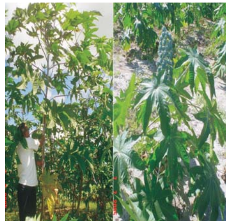
Fig. 3. Exemplos de plantas de uma mesma cultivar, mas com grande diferença na altura de inserção do primeiro racemo.

Não é desejável que a planta cresça muito antes de lançar o primeiro cacho, pois esse comportamento indica que ela está gastando grande parte de sua energia para crescimento ao invés de direcioná-la para a produção de sementes e também porque é mais difícil colher cachos muito altos. O comprimento dos internódios pode ser observado como um registro das condições em que a planta cresceu, pois nas fases em que há boas condições ambientais (água e nutrientes), os internódios são longos e nos períodos de seca ou condições adversas, os internódios são curtos (Fig. 4). Existem algumas cultivares de mamoneira que naturalmente possuem os internódios muito curtos (variedades anãs), mas que também podem ter essa característica influenciada pelas condições ambientais.