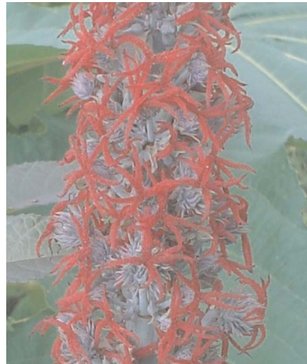
Fig. 7. Estigmas das flores femininas anormalmente alongados devido à dificuldade de polinização.

Segundo Rizzardo (2007), estigmas das flores muito alongados (Fig. 7) são um indicativo de dificuldade para a polinização, pois, por não ter sido fecundada, esta estrutura receptora continua crescendo para aumentar a possibilidade de receber um grão de pólen (no momento da foto, as flores já estavam fecundadas).