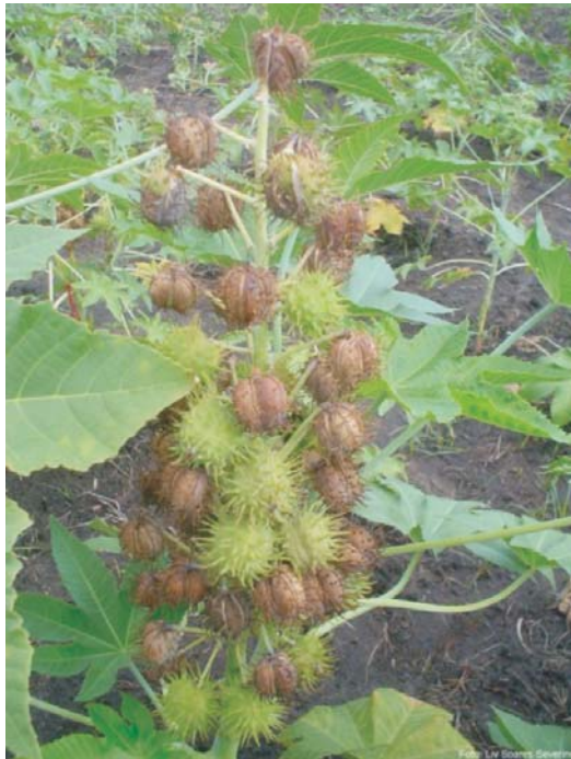
Fig. 8. Exemplo de maturação desuniforme entre frutos de um mesmo cacho e entre lóculos de um mesmo fruto.

As sementes passam por diferentes fases de desenvolvimento. Logo após a fecundação, elas ainda são muito pequenas, sendo difícil visualizá-las dentro dos frutos. Até cerca de 20 dias após o aparecimento das inflorescências, as sementes encontram-se na fase chamada "leitosa", quando o endosperma ainda é líquido (MOSHKIN, 1986). Aos 30 dias, inicia-se a maturação, fase em que o tegumento começa a ganhar sua cor característica; pesam cerca de 0,12 g (matéria seca), mas com teor de umidade ainda é muito alto (90,3%). O tamanho da semente muda pouco após os 30 dias.