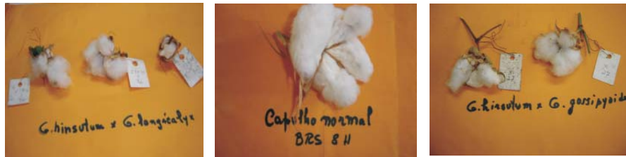
Fig. 2. Capulho de algodão alotetraplóide ( BRS 8H) e de seus híbridos com espécies diplóides

capulhos do cruzamento com G. nelsonii , estando as plantas triplóides deste cruzamento na Figura 3. As sementes obtidas eram poucas em número, ou seja, em torno de apenas 7-10 sementes por cruzamento e de tamanho reduzido. Embora se tenha feito cruzamentos em várias flores, a maioria das maçãs abortava ainda bastante jovem e, em alguns casos, em estágio mais avançado. Após o plantio das sementes F1 em tubos de ensaio e retirada das plantas F1 triplóides para plantio em vasos, apenas duas plantas F1 sobreviveram, do cruzamento com G. nelsonii (Figura 3); nos demais cruzamentos as plântulas F1 não sobreviveram. Novos cruzamentos estão sendo realizados.