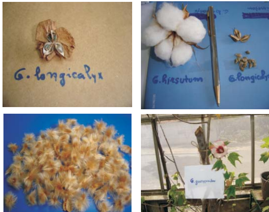
Fig. 1. Espécies de algodão utilizadas nos cruzamentos

G. longicalyx possui cor cinza da fibra, G. nelsonii cor dourada e G. gossypioides , verde (Figura1). Sementes F1 foram obtidas nos três cruzamentos (Figura 2), apesar de não serem mostrados, nesta figura, os