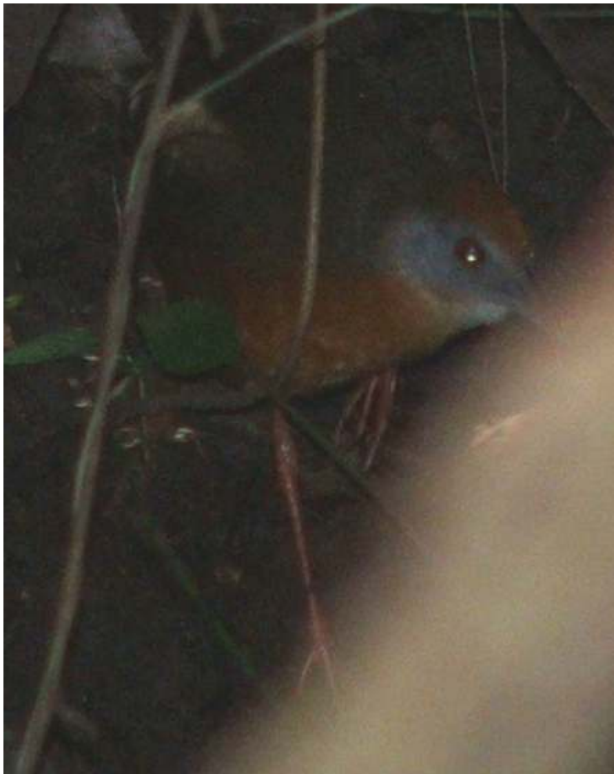
Fig. 1. Laterallus viridis registrada em mata da Embrapa Agropecuária Oeste , em Dourados, MS, em 2005.