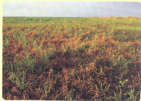
CAMPO ATACADO POR BRUSONE