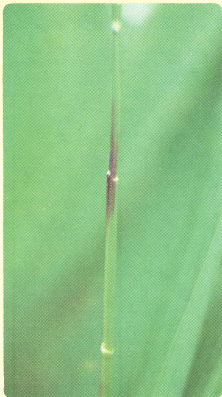
BRUSONE NO PESCOÇO DA PANÍCULA