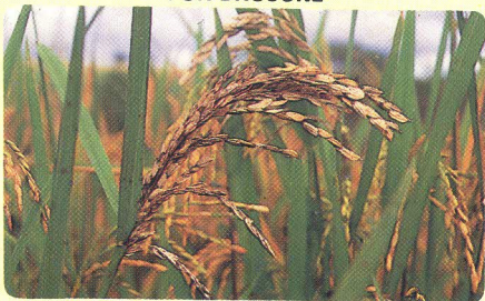
PANÍCULA ATACADA POR BRUSONE