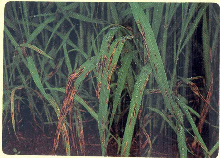
BRUSONE DAS FOLHAS