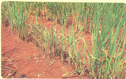
FOLHAS BAIXAS ATACADAS POR BRUSONE