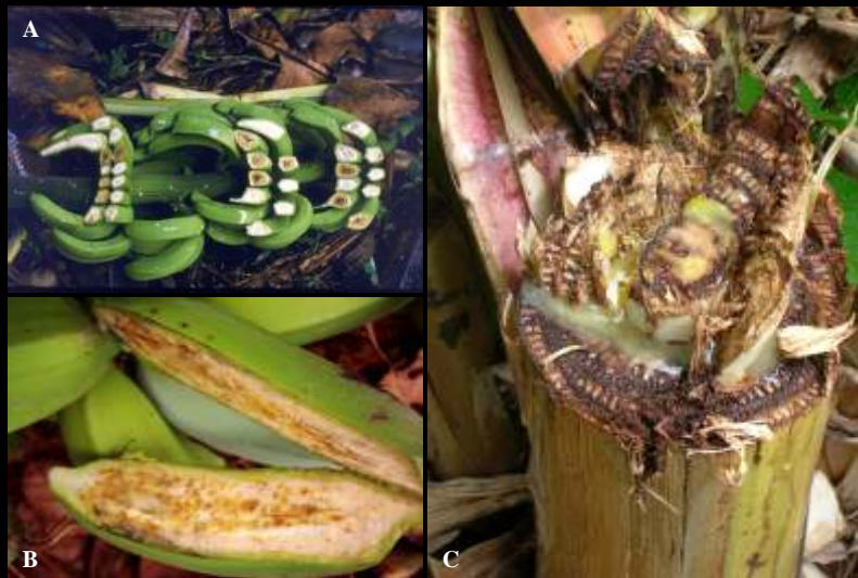
Fig. 2 - Murcha da bananeira, causada por Xanthomonas vasicola pv. musacearum . A – Internamente os frutos permanecem firmes, mas alteram a coloração para marrom avermelhada; B – Frutos amadurecem prematuramente e apresentam coloração marrom avermelhada; C – Corte transversal do pseudocaulo com exsudação de pus bacteriano amarelo.