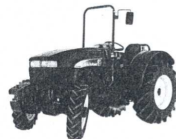
Trator TT 3880 F