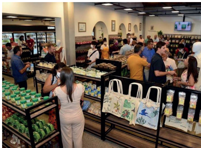
Figura 3. Visão interna do Armazém da Caatinga.

mel, licuri e artesanatos. Um restaurante denominado “ Restaurante Caatingueiros ”, com uma enorme variedade de opções, entre produtos, bebidas e pratos regionais, naturais e orgânicos, e também, um espaço para feira agroecológica e orgânica.