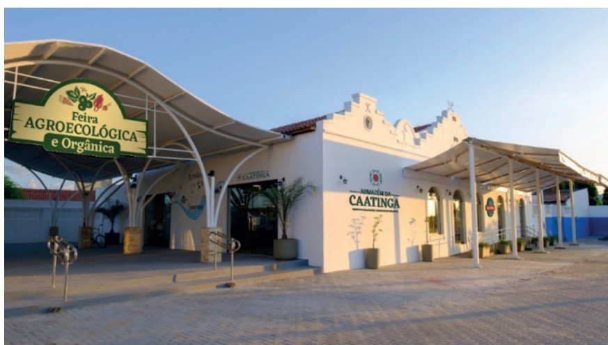
Figura 2. O Armazém da Caatinga “Produtos da Agricultura Familiar Brasileira”.