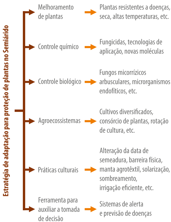
Figura 3. Estratégias de adaptação para a proteção de plantas frente às mudanças climáticas.

práticas culturais; o uso de modelos de alerta e previsão; o desenvolvimento de novas moléculas com maior eficácia no controle de doenças em ambientes com aumento da temperatura; a alteração na data de semeadura para evitar a ocorrência da epidemia; a seleção de bioagentes com ampla faixa de ação em temperaturas altas; e a adoção de práticas de manejo como policultivos e rotação, entre outras (Figura 3) (Gupta et al., 2018; Pathak et al., 2018).