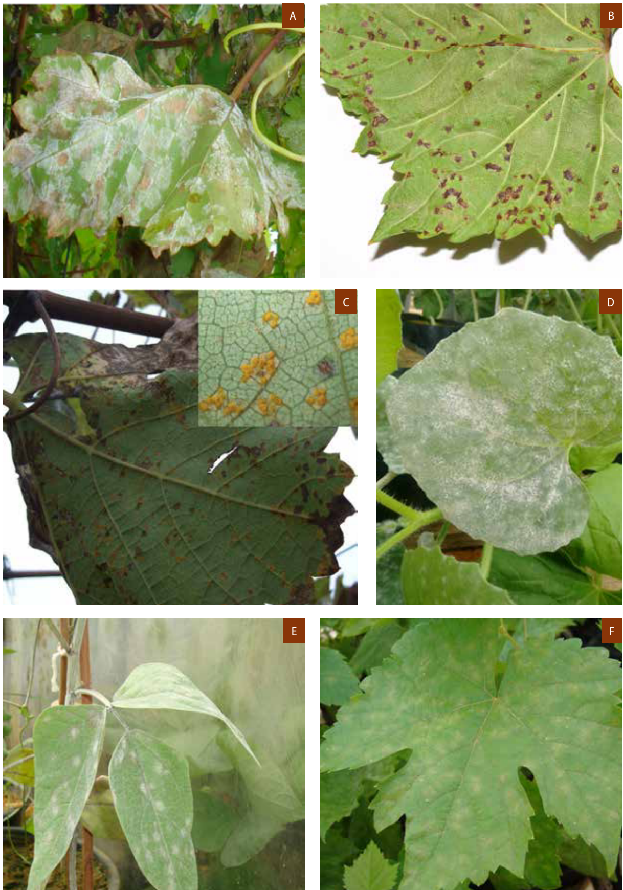
Figura 2. Diferentes patossistemas estudados em condições controladas no Semiárido brasileiro: míldio da videira (A); cancro bacteriano da videira (B); ferrugem da videira (C); oídio do meloeiro (D); oídio do feijão-caupi (E); oídio da videira (F).