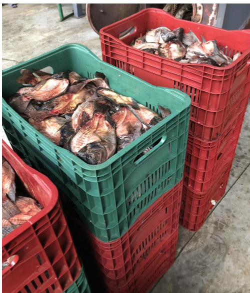
Figura 2. Coprodutos oriundos da filetagem de tilápias.